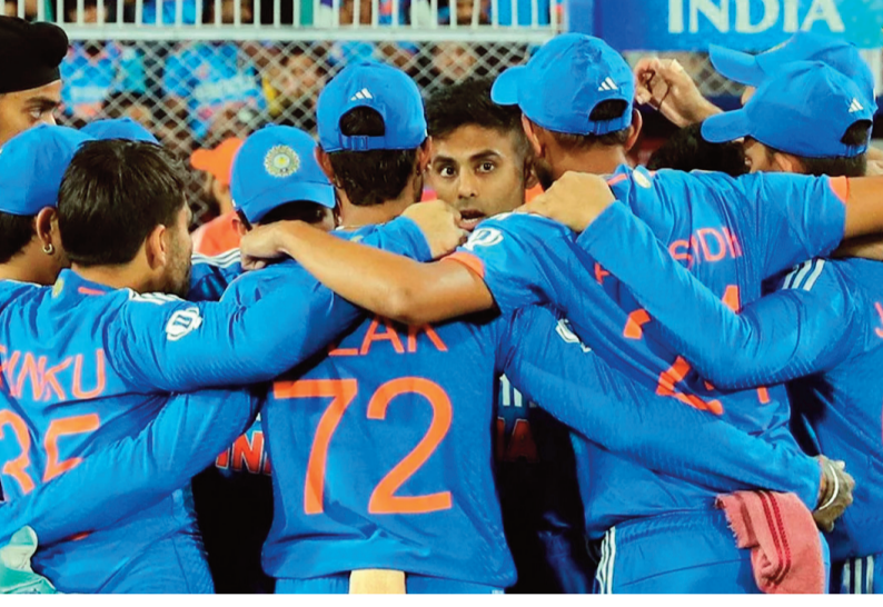
అవసరం కాగా జోరుమీదున్న మ్యాచ్లో అలవో కగా బాడేసి జట్టుకు విజయాన్ని అందింపెట్టాడు. అయితే, మరో రెండు మ్యాచ్లు మిగిలి ఉండడంతో సిరీస్పై భారత్ ఆశలు సజీవంగా ఉన్నాయి.

అక్షర పటేల్ వేసిన 19వ ఓవర్ నాలుగో బంతిని మాధ్యమ వేడ్ ముందుకొచ్చి ఆడి ప్రయత్నం చేశాడు. బంతి మిస్సై ఇషాన్ కిషన్ చేతిలో పడడం, ఆ వెంటనే స్టంపింగ్ చేయడం చకచకా జరిగిపోయాయి. అయితే, రిఫ్రీలో అది నాబాల్గా తేలింది. అక్కడి వరకు బాగానే ఉన్నా ఆ తర్వాత భారత్ కొంప మునిగే పని జరిగింది. బంతిని అందుకునే క్రమంలో ఇషాన్ గ్లోవ్ స్టంప్ కన్నా ముందుకు రావడంతో అంపైర్ ఆ బంతిని నోబాల్గా ప్రకటించి ఫ్రీ హిట్ ఇచ్చాడు. ఐసీసీ నిబంధనల ప్రకారం బౌలర్ బంతి వేసిన తర్వాత వికెట్ల వెనకాలే ఉండాలి. కానీ, ఇషాన్ గ్లోవ్ స్టంప్ కన్నా ముందుకు రావడంతో అది నోబాల్ అయింది. ఫ్రీహిట్ బంతికి వేడ్ రెచ్చిపోయాడు. ఫ్రీహిట్ను సద్దీనియోగా చేసుకుంటూ సిక్స్ కొట్టడంతో మ్యాచ్ ఒక్కసారిగా పర్వాలకు జట్టు చేతిలోకి వెళ్లి భారత్ ఓటమి భావమైంది. అలాగే, అదే ఓవర్ చివరి బంతికి టైన్ రూపంలో మరో నాలుగు పరుగులు రావడంతో ఆస్ట్రేలియా శిబిరంలో సంచలనం చేసుకున్నారు. చివరి ఓవర్లో ఆస్ట్రేలియా విజయానికి 21 పరుగులు