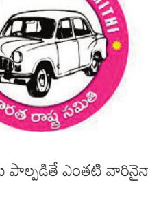
కార్యకలాపాలకు పాల్పడితే ఎంతటి వారినినైనా

నియమ నిబంధనలు ఉల్లంఘించారని పేర్కొన్నారు. ఎన్నికల్లో బీఆర్ఎస్ పార్టీకి పనిచేయకపోగా, అవతలి పార్టీకి సహకరిస్తున్నారని చెప్పారు. ఇప్పటి నుంచి వాళ్లకు, పార్టీకి ఎలాంటి సంబంధం లేదని ఆదివారం ఒక ప్రకటనలో స్పష్టం చేశారు. బీఆర్ఎస్ పార్టీ ప్రతి కార్యకర్తను కంటికి రెప్పలా కాపాడుకుంటుందన్నారు. అదే సమయంలో పార్టీ వ్యతిరేక