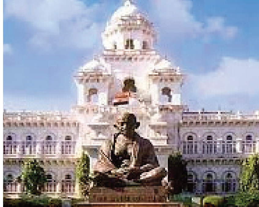
కమ్మలు వారి జనాభా తక్కువగా ఉన్నా అసెంబ్లీలో మెజారిటీ సీట్లలో వారే ఉంటున్నారు. 40 ఏళ్లుగా అధికారంలో ఉన్న పార్టీతో సంబంధం లేకుండా రెడ్డి ఎమ్మెల్యేలు సగటున 30 నుంచి 43, వెలమలు 8 నుంచి 13 మధ్య, కమ్మలు 3 8 మధ్య, అధికారంలో ఉన్న పార్టీతో సంబంధం లేకుండా రెడ్డి జనాభాలు 1 నుంచి 7 మధ్య ఉన్నారు.

సీట్లు. ఈ సీట్లలో మిగిలినవారు పోటీచేసి చాన్స్ లేదు. మొత్తం 19సీట్లలో ఎన్నోలు, 12సీట్లలో ఎన్నోలు నిలబడతారు. ఇక మిగిలిన 88సీట్లు ఓపెన్ క్యాటగిరి. అంటే ఎవరైనా నిలబడతారు. ఈ 88సీట్లలో ఈసారి 43 మంది రెడ్డిలు, 13 మంది వెలమలు, నలుగురు కమ్మలు, బ్రాహ్మణులు, వైశ్యకులాల నుంచి ఒక్కొక్కరు అసెంబ్లీలో అడుగుపెడతారు. అంటే 119 మంది ఎన్నికైన ప్రతినిధులలో 52శాతం అగ్రకులాల వారే ఉన్నారు. ఇటీవలి కాలంలో ఎక్కువగా కులగణన గురించి దేశవ్యాప్తంగా తీవ్ర చర్చజరిగింది. ముఖ్యంగా బీసీల శాతం తేల్చేందుకు కులగణన చేపడతామని పలు పార్టీలు ప్రకటించాయి. బీసీల సంఖ్య ఎక్కువగా ఉన్న చోట్ల రిజర్వేషన్ శాతాన్ని పెంచుతామని చెప్పాయి. ఇక తెలంగాణలో గెలిస్తే బీసీనే సీఎంగా చేస్తామని బీజేపీ ప్రకటించింది కూడా. అయితే నిజానికి బీసీ ఎమ్మెల్యేల సంఖ్య చాలా తక్కువగా ఉంది. ఈ సారి తెలంగాణ అసెంబ్లీలో అడుగుపెట్టేవారిలో 19 మంది బీసీ ఎమ్మెల్యేలు ఉన్నారు. అంటే 16శాతం మంది బీసీలన్నమాట. అటు బీసీ జనాభా 50శాతానికి పైగా ఉందని అంచనా. ఇక 1983 నుంచి తాజా అసెంబ్లీ ఎన్నికల వరకు రెడ్డిలు, వెలమలు,