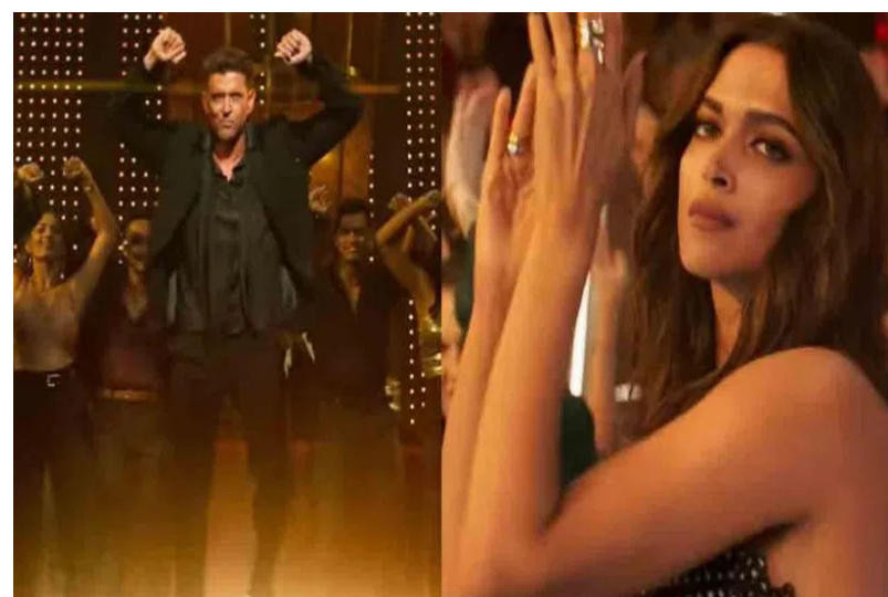
స్వాధీన లీడర్ షంషేర్ పతానియా (పాటీ)గా పదుకొణె.. గ్రూప్ కెప్టెన్ రాకేష్ జై సింగ్ పాత్రలో కనిపించనుండగా.. స్వాధీన లీడర్ మిన్నిగా (దీపికా అనిల్ కపూర్ కనిపించనున్నారు.