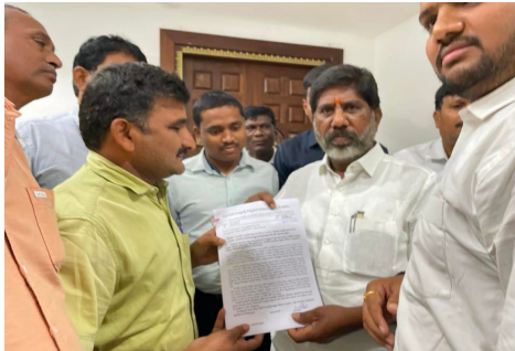
సింగరేణి యాజమాన్యం గత రాష్ట్ర ప్రభుత్వానికి రాసిన లేఖ.

తెలంగాణ వీణ/భద్రాద్రి కొత్తగూడెం ప్రతినిధి: సింగరేణి కాంట్రాక్ట్ కార్మికుల వేతన పెరుగుదల ఇతర సమస్యల పరిష్కారానికి చొరవ చూపించాలని కోరుతూ సోమవారం ఉప ముఖ్యమంత్రి భట్టి విక్రమార్కుకు సిబ్బంది యు వివరణ అందజేసింది.