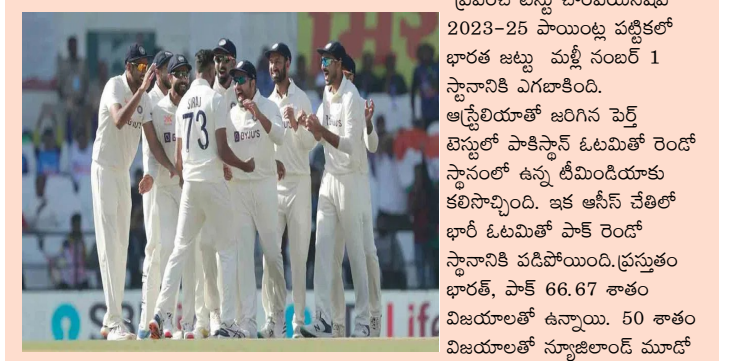
స్థానంలో నిలిచింది. స్వదేశంలో కివీస్ పై చారిత్రాత్మక టెస్టు విజయం సాధించిన బంగ్లాదేశ్ నాలుగు, ఆస్ట్రేలియా ఐదు, వెస్టిండీస్ ఆరు స్థానాల్లో కొనసాగుతున్నాయి.