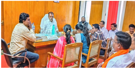
వారితో కలిసి గ్రామ గ్రామాల్లో మిషన్ భగీరథ నీటిలోని (టి.డి.ఎస్) పరిశీలించారు 220 కనిష్టం నుంచి 350 గరిష్ట స్థాయి ఉందని అన్నారు ఈ సందర్భంగా వారు మాట్లాడుతూ రాష్ట్రంలో ఏ ఒక్క గ్రామంలో నైనా మిషన్ భగీరథ నీళ్లను తాగడం లేదని ప్రతి ఒక్క కుటుంబం నెలకు ?500 నుంచి 1000