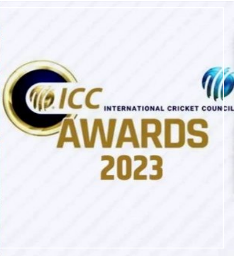
పురుషుల 'వన్డే క్రికెటర్ ఆఫ్ ది ఇయర్ 2023' అవార్డుకు పోటీ పడుతున్న నలుగురు క్రికెటర్ల పేర్లను ఐసీసీ ప్రకటించింది. ఈ నలుగురు

షేయర్స్ లో ముగ్గురు టీమిండియా ఆటగాళ్లే ఈ అవార్డు రేసులో పోటీ పడుతున్నారు. ఐసీసీ.. పురుషులు, మహిళలలో అత్యుత్తమ ప్రతిభను కనబర్చిన వారికి ప్రతి సంవత్సరం అన్ని ఫార్మాట్లలో ఈ అవార్డులను అందజేస్తుంది. 2023 సంవత్సరానికి గాను వన్డే ఫార్మాట్ లో క్రికెటర్ ఆఫ్ ది ఇయర్ అవార్డుకు నామినేషన్లను ప్రకటించింది. ఈ అవార్డు కోసం పోటీ పడుతున్న నలుగురు ఆటగాళ్ల పేర్లను తాజాగా వెల్లడించింది ఐసీసీ. ఇందులో ముగ్గురు ఇండియన్ షేయర్స్ విరాట్ కోహ్లీ, మహ్మద్ షమీ, శుభ్ మన్ గిల్ లతోపాటు న్యూజిలాండ్ ఆటగాడు దారిల్ మిచెల్ ఉన్నారు. ఈ నలుగురిలో మీరు ఓపికతో ఓటమి వేసారంటూ ఐసీసీ ట్వీట్ చేసింది. మరి, ఈ నలుగురిలో వన్డే క్రికెటర్ ఆఫ్ ది ఇయర్ అవార్డును ఎవరు అందుకుంటారో చూడాలి. ఇక, మహిళా వన్డే క్రికెట్ ఆఫ్ ది ఇయర్ అవార్డు కోసం శ్రీలంక, అస్ట్రేలియా, న్యూజిలాండ్, ఇంగ్లాండ్ షేయర్స్ పోటీపడుతున్నారు.