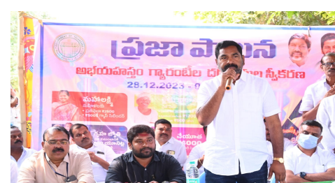
ఏఈఓ ఎంఈఓ సీఈఓ సిడిపివో మధురిమ పోలీస్ అధికారులు ఆర్పీలు ఆసా కార్యకర్తలు హాన్సన్ పర్తి మండల కాంగ్రెస్ పార్టీ నాయకులు కార్యకర్తలు వివిధ అనుబంధ సంఘాల నాయకులు అభిమానులు తదితరులు పాల్గొన్నారు.