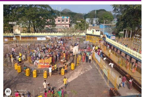
స్థానిక మండ్రి సీతక్క కూడా మేడారంలో పర్యటించారు. జాతర అభివృద్ధి పనులను పర్యవేక్షించారు. నార్లాపూర్ నుండి వచ్చే రహదారి మొత్తం మరమ్మతులు త్వరగా పూర్తి చేయాలనీ అధికారులకు మండ్రి సీతక్క దిశానిర్దేశం చేశారు. మార్గంలో మధ్యలో భక్తులకు ఎలాంటి ఇబ్బందులు తలెత్తకుండా తగు చర్యలు తీసుకోవాలని ఆదేశాలు జారీ చేశారు. పనుల్లో ఏమాతం నిర్లక్ష్యం వహించినా సహించే (పసక్తి లేదని రాష్ర్మ (పభుత్వం అత్యంత ప్రతిష్ఠాత్మకంగా నిర్వహించే జాతరను అన్ని శాఖలు సమన్వయంతో సక్సెస్ చేయాలని మండ్రి సీతక్క సూచించారు.

సమయంలో లక్షలాది మంది భక్తులతో కిక్కిరిసిపోయి ఉంటుంది. జాతర సమయంలో తోపులాటలు ఎక్కువగా జరిగే అవకాశం ఉంటుంది. కాబట్టి కుటుంబ సమేతంగా ఆ సమయంలో దర్శనం చేసుకోవడం ఇబ్బందికరంగా ఉంటుందని అందుకే ముందే వచ్చి కుటుంబ సమేతంగా మొక్కులు చెల్లించుకుంటున్నామని అంటున్నారు.అయితే జాతరకు ముందుగానే భక్తుల తాకిడి విపరీతంగా పెరిగిపోవడంతో అధికార యండ్రాంగం కూడా ప్రత్యేక ఏర్పాట్లు చేపట్టారు. జాతరకు వచ్చే నాలుగు ప్రధాన రహదారులలో ప్రత్యేకంగా పార్మింగ్కు కూడా ఏర్పాటు చేశారు.