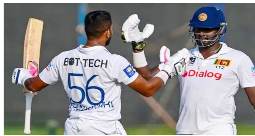
కొలంబో: అఫ్ఘానిస్తాన్తో జరుగుతున్న ఏకైక టెస్టు మ్యాచ్లో ఆతిథ్య శ్రీలంక టీమ్

మ్యాచ్ను శాసించే స్థితికి చేరుకుంది. అఫ్ఘాన్ తొలి ఇన్నింగ్స్లో 198 పరుగులకు ఆటోట్రింది. తర్వాత మొదటి ఇన్నింగ్స్ చేపట్టిన శ్రీలంక శనివారం రెండో రోజు ఆట ముగిసే సమయానికి ఆరు వికెట్ల నష్టానికి 410 పరుగులు చేసింది. లంకకు ఇప్పటికే 212 పరుగుల అధికం లభించింది. సీనియర్ ఆటగాళ్లు ఎంజిలో మాథ్యూస్, దినేష్ చండీమల్లు శతకాలతో లంకను ఆడుకున్నారు. కీలక ఇన్నింగ్స్ ఆడిన మాథ్యూస్ 14 ఫోర్లు, మూడు సిక్సర్లతో 141 పరుగులు చేసి హిట్ వికెట్గా పెవిలియన్ చేశాడు. దినేష్ చండీమల్ 10 ఫోర్లు, ఒక సిక్సర్తో 107 పరుగులు సాధించాడు. ఓపెనర్ దిముత్ కరుణరత్నే 77 పరుగులు చేసి తనవంతు సహకారం అందించాడు.