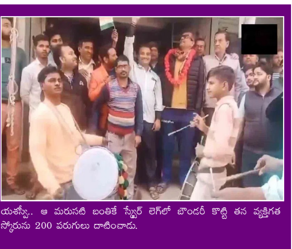
యశస్వి.. ఆ మరుసటి బంతికే స్వేచ్ఛ లెగ్లో బౌండరీ కొట్టి తన వ్యక్తిగత స్కోరును 200 పరుగులు దాటించాడు.

డబుల్ సెంచరీ హీరో యశస్వి జైస్వాల్ ఇలాకాలో సంబురాలు.. ఇంగ్లండ్తో రెండో టెస్టులో డబుల్ సెంచరీ చేసిన భారత యువ క్రికెటర్ యశస్వి జైస్వాల్ ఇలాకాలో సంబురాలు జరుగుతున్నాయి. యశస్వి స్వస్థలం అయిన ఉత్తరప్రదేశ్ లోని బడోహిలో క్రికెట్ అభిమానులు సంబురాలు చేసుకుంటున్నారు. పటాకులు కాల్చి, స్వీట్లు పంపకుని ఒకరికొకరు శుభాంక్షలు చెప్పుకుంటున్నారు. దప్పుచప్పుళ్లతో సైబిల్లు వేశారు. ఈ సంబురాలకు సంబంధించిన దృశ్యాలను కింది వీడియోలో చూడవచ్చు. కాగా, ఇంగ్లండ్తో వైజాగ్లో జరుగుతున్న రెండో టెస్టులో యశస్వి జైస్వాల్ (207 నాటోట్) డబుల్ సెంచరీ కొట్టాడు. ఓవర్ నైట్ సోర్ 179తో రెండో రోజు క్రికెట్లోకి వచ్చిన ఈ యంగ్ ప్లయర్ తొలి సెంచరీ మొదలైన కాసేటికే తొలి ద్విశతకం బాదాడు. 191 పరుగుల పద్ద షోయట్ బషీర్ బౌలింగ్లో సిక్సర్ బాదిన