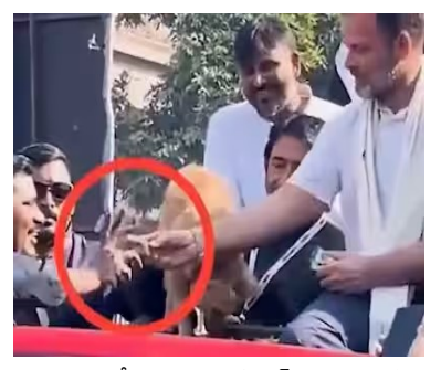
ప్రయత్నం చేశారు.తాను బిస్కట్ ఇవ్వాలనుకున్న కుక్కపిల్ల తమ పార్టీ కార్యకర్తదే అన్నారు. ఆ కుక్కపిల్ల తాను ఇచ్చిన బిస్కట్ తినక పోవడంతో, యజమాని చేతికి ఇచ్చి పెట్టమన్నానని స్పష్టం చేశారు. కుక్కను

తెలంగాణ వీణ/రాంచీ : భారత్ జోదో న్యాయ్ యాత్రలో ఏఐసీసీ అగ్రనేత రాహుల్ గాంధీ ఓ కార్యకర్త చేతికి కుక్క బిస్కట్లు ఇచ్చినట్టగా వైరల్ అయిన వీడియోపై బీజేపీ నేతలు విమర్శలు గుప్పిస్తున్నారు. అసోం ముఖ్యమంత్రి హిమంత్ బిశ్వ శర్మ కాం(గెస్ అగ్రనేతపై ఇప్పటికే విమర్శలు గుప్పించారు. రాహుల్ గాంధీ తన కార్యకర్తలకు కుక్క తినే బిస్కట్లు ఇస్తున్నారని... కార్యకర్తలను కుక్కల్లా చూస్తున్నారని తీవ్ర వ్యాఖ్యలు చేశారు. ఇతర బీజేపీ నేతలు కూడా విమర్శలు గుప్పిస్తున్నారు. రాహుల్ గాంధీ బిస్కట్లు వేయగా ఓ కుక్క తినలేదు. దీంతో తన చేతిలోని బిస్కట్లను రాహుల్ గాంధీ ఓ కార్యకర్త చేతికి ఇచ్చారు. కుక్క తినదానికి ఇష్టపడని బిస్కట్ ను కార్యకర్తకు అందిస్తున్నట్లుగా వీడియోలో ఉంది. ఇది వైరల్ కావడం... బీజేపీ నేతలు విమర్శించడంతో రాహుల్ గాంధీ వివరణ ఇచ్చే