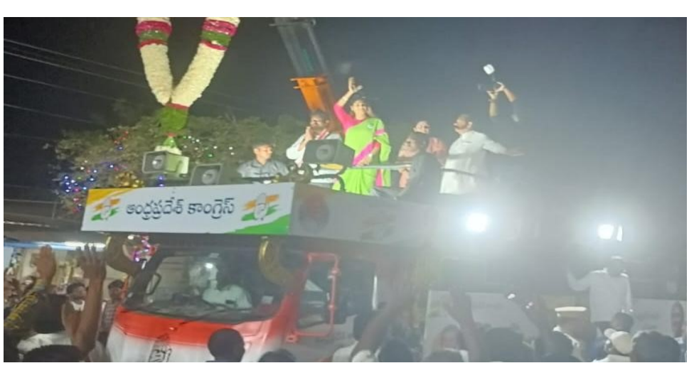
నోట్లు ఇస్తారు తీసుకొని ఓటు మాత్రం కాంగ్రెస్క్ వేయాలని పద్మ కాంగ్రెస్ కార్యకర్తలు మహిళలు యువకులు పాల్గొన్నారు.