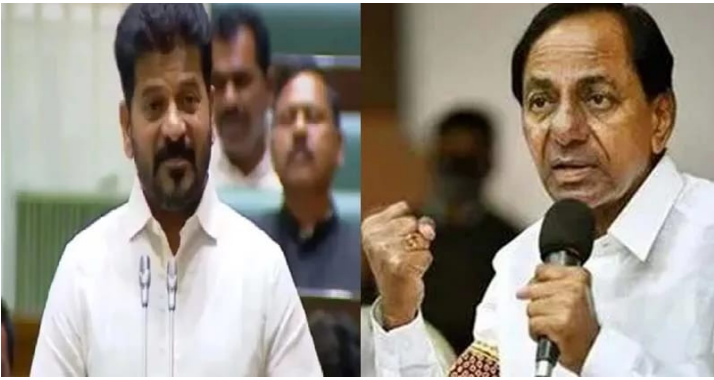
- మొన్నటి ఎన్నికల్లో బొక్కబోర్లా పడ్డా బిఆర్ఎస్ వాళ్లకు బుద్ధిరాలేదని పైర్

ఒక సీఎంను పట్టుకుని 'ఏం పీకనీకి పోయినవు' అని అంటారా?: సీఎం రేవంత్