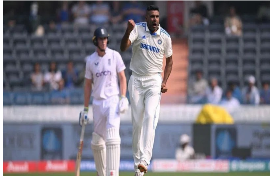
అశ్విన్ నిలిచాడు. ఈ జాబితాలో మురళీధరన్ అగ్రస్థానంలో ఉండగా.. ఆ తర్వాత షేన్ వార్నర్, నాథన్ లియాన్ లు ఉన్నారు. అశ్విన్ నాలుగో స్థానంలో ఉన్నాడు. అత్యంత వేగంగా.. (105), షేన్ వార్నర్ (108), గ్లెన్ మెక్ గ్రాత్ (110)లు తర్వాతి స్థానాల్లో నిలిచారు.

టీమిండియా వెటరన్ అశ్విన్ రవిచంద్రన్ అశ్విన్ టెస్టులలో మరో అరుదైన ఘనత అందుకున్నాడు. ఇంగ్లండ్ రాజ్ కోట్ టెస్టులో అశ్విన్.. 500 వికెట్ల మైలురాయిని అందుకున్నాడు. ఇంగ్లండ్ తొలి ఇన్నింగ్స్ లో భాగంగా ఆ జట్టు ఓపెనర్ జాక్ క్రాలోను జైట్ చేయడంతో అశ్విన్.. బందోల వికెట్ల క్లబ్ లో చేరాడు. అశ్విన్ ఈ ఘనత సాధించడంతో అతడు పలు రికార్డులను అందుకున్నాడు. భారత్ తరపున అత్యధిక వికెట్లు సాధించిన అనిల్ కుంభే తర్వాత రెండో స్థానంలో ఈ తమిళ తంబీయే ఉన్నాడు. అంతర్జాతీయ స్థాయిలో టెస్టులలో అత్యధిక వికెట్లు తీసిన బొలెర్ లో అశ్విన్ 9 వ స్థానంలో ఉన్నాడు. ఈ జాబితాలో లంక దిగ్గజం ముత్తయ్య మురళీధరన్.. 800 వికెట్లతో ఎవరికీ అందనంత ఎత్తులో ఉన్నాడు. ఆ తర్వాత ఆసీస్ స్పిన్ దిగ్గజం షేన్ వార్నర్ (708) ఉండగా.. ఇంగ్లండ్ సీనియర్ బొలెర్ జేమ్స్ అండర్సన్.. 696 వికెట్లతో మూడో స్థానంలో నిలిచాడు. కుంభే (619), స్టూవర్ట్ బ్రాడ్ (604), గ్లెన్ మెక్ గ్రాత్ (563), కోట్నీ వాల్స్ (519), నాథన్ లియాన్ (517)లు అశ్విన్ కంటే ముందున్నారు. నాలుగో స్పిన్నర్.. టెస్టులలో 500 షట్టర్లు తీసుకున్న నాలుగో స్పిన్నర్ గా