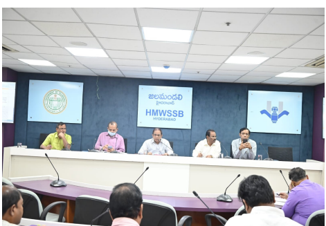
కింద మరమ్మత్తులు చేయాలని వివరించారు. అవసరానికి సరిపడా వాయిల్లను, జంక్షన్లు, తదితర సామగ్రిని సెంట్రల్ స్టోర్ లో అందుబాటులో ఉండేలా చూసుకోవాలని సంబంధిత జీఎంస ఆదేశించారు.