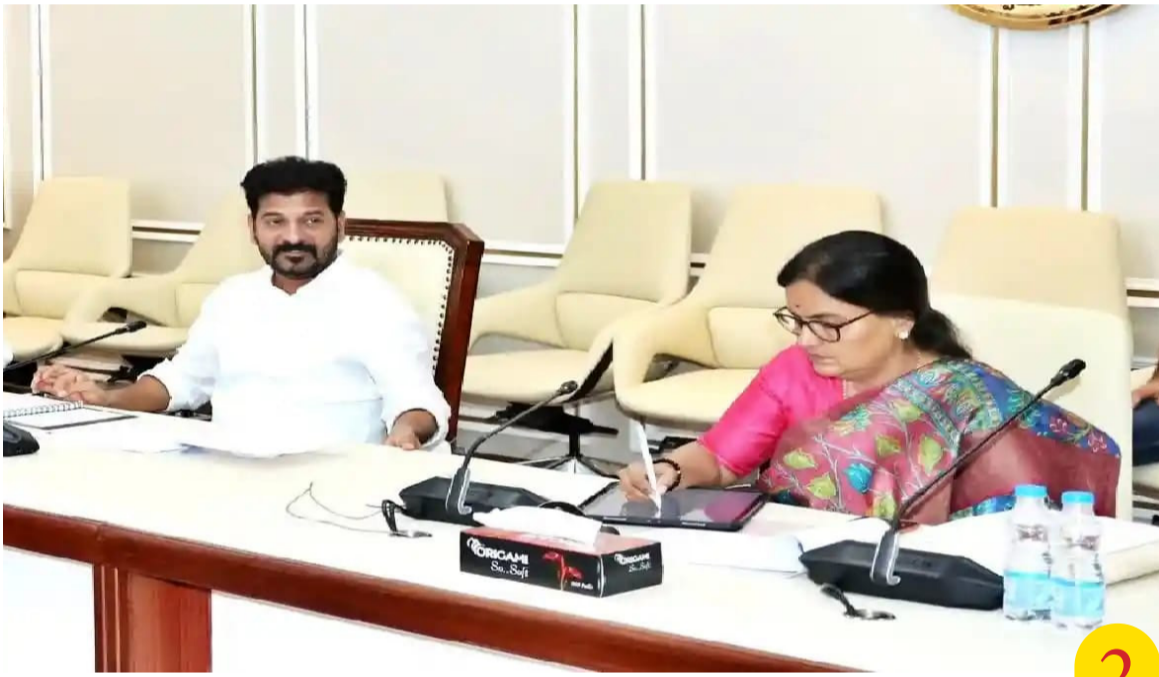
తెలంగాణవీణ, హైదరాబాద్ /

-ప్రాథమిక నివేదిక ఆధారంగా ఏసీబీకి ఇవ్వాలని ఆదేశాలు. -ఏప్రిల్ నుంచి పొడి రైతులకు ప్రోత్సాహకం చెల్లింపు.