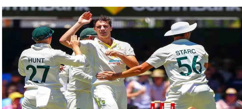
ఆస్ట్రేలియా కెప్టెన్ ప్యాట్ కమిన్స్ అరుదైన ఫీట్ సాధించాడు. కంగారూ జట్టు తీయగా.. షాన్ పొలాక్ 50 ఇన్నింగ్స్లో 103 వికెట్లు పడగొట్టాడు.

సారథిగా 100 వికెట్లు పడగొట్టాడు. న్యూజిలాండ్తో జరుగుతున్న తొలి టెస్టులో దారిల్ మిచెల్ను ఔట్ చేసిన కమిన్స్ 100 వికెట్ల ఖాతాలో వేసుకున్నాడు. దాంతో, ఈ ఘనతకు చేరువైన పదో కెప్టెన్ గా కమిన్స్ రికార్డు సృష్టించాడు. అతడి కంటే ముందు భారత మాజీ కెప్టెన్ కపిల్ దేవ్ దక్షిణాఫ్రికా ఆల్ రౌండర్ షాన్ పొలాక్, పాకిస్థాన్ మాజీ పేసర్ వసీమ్ అక్రమ్, వెస్టిండీస్ ఆల్ రౌండర్ జేసన్ హెవ్లర్లు ఈ ఫీట్ సాధించారు. ఇప్పటి వరకు పైగా వికెట్లు తీసిన ఆటగాళ్ల జాబితాలో పాక్ మాజీ సారథి ఇమ్రాన్ ఖాన్ ఆగ్రస్థానంలో కొనసాగుతున్నాడు. ఇమ్రాన్ 71 ఇన్నింగ్స్లో 187 వికెట్లు తీశాడు. కపిల్ దేవ్ 58 ఇన్నింగ్స్లో 111 వికెట్లు