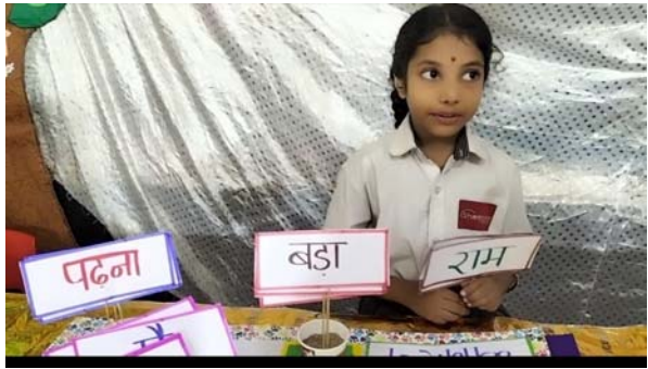
తెలంగాణ వీణ / పరంగల్ జిల్లా:-

పరంగల్ పట్టణం దుర్గేశ్వర స్వామి దేవస్థానం సమీపంలో గల శాంతినికేతన్ ఇంగ్లీష్ మీడియం హై స్కూల్ లో పిల్లలకు విద్య వారి మేధాశక్తికి తోడ్పడుతూ వినూత్నంగా గత పది సంవత్సరాలుగా ఓపెన్ హౌస్ కార్యక్రమం అన్ని తరగతుల వారికి నిర్వహిస్తున్నారు. ఇదే క్రమంలో ఈ సంవత్సరం కూడా ఓపెన్ హౌస్ కార్యక్రమం నిర్వహించారు. ఈ కార్యక్రమం ద్వారా విద్యను, వ్యక్తిత్వ శక్తి ఉపయోగపడే ద్వారా మాంట్ సరి ఏజ్ పిల్లల నుండి 5వ తరగతి విద్యార్థుల వరకు అన్ని నట్లెక్కులలో ముఖ్యమైన పాఠాల నుండి సేకరించి ప్రత్యేక ప్రదర్శన నిర్వహించారు. ఈ ప్రదర్శన ద్వారా ప్రతి ఒక్క విద్యార్థి