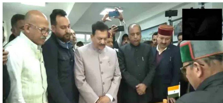
కాంగ్రెస్ ఎమ్మెల్యేలు రాజీనామా చేసి బీజేపీలో చేరిన ముగ్గురు ఇండిపెండెంట్లు..!

హిమాచల్ ప్రదేశ్ : హిమాచల్ ప్రదేశ్ లో కాంగ్రెస్ ప్రభుత్వంపై నీలిసీడలు కమ్ముతున్నాయి. ఇప్పటికే కాంగ్రెస్ పార్టీకి చెందిన ఆరుగురు ఎమ్మెల్యేలు రాజీనామా వచ్చిన సందర్భంగా పార్టీ వివేకం ధిక్కరించి ఎన్డీఏ అభ్యర్థికి ఓటువేశారు. ప్రతిపక్ష బీజేపీకి అనుకూలంగా వ్యవహరిస్తూ కాంగ్రెస్ సర్కారుపై తిరుగుబాటు చేశారు. దాంతో హిమాచల్ స్పీకర్ ఆ ఆరుగురు ఎమ్మెల్యేలను సస్పెండ్ చేశారు. ఇటీవల షెడ్యూల్డ్ విధుల చేసిన కేంద్ర ఎన్నికల సంఘం ఆ ఆరు స్థానాలకు ఉప ఎన్నికలు నిర్వహిస్తున్నట్లు ప్రకటించింది. గత అసెంబ్లీ ఎన్నికల్లో మొత్తం 68 స్థానాలకుగాను 40 స్థానాలు దక్కించుకున్న కాంగ్రెస్ ప్రభుత్వాన్ని ఏర్పాటు చేసింది. మ్యాజిక్ ఫిగర్ కేవలం 6 సీట్లు ఎక్కువగా కాంగ్రెస్ కు వచ్చాయి. ఈ క్రమంలో బీజేపీ కాంగ్రెస్ ప్రభుత్వాన్ని కూల్చే ప్రయత్నం చేసింది. అందులో భాగంగానే ఆరుగురు కాంగ్రెస్ ఎమ్మెల్యేలు తిరుగుబాటు చేసి అనర్హత వేటుకు గురయ్యారు. ప్రస్తుతం కాంగ్రెస్ పార్టీ కి 34 మందితో బొటాబొటీ మెజారిటీ మాత్రమే ఉన్నది. మరో ఎమ్మెల్యే చేజిరినా హిమాచల్ లో కాంగ్రెస్ సర్కారు