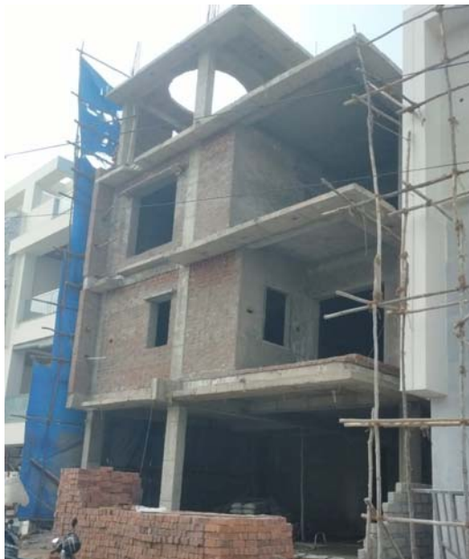
కాప్రా అరెంకే ప్రతిష్ఠల్లో...