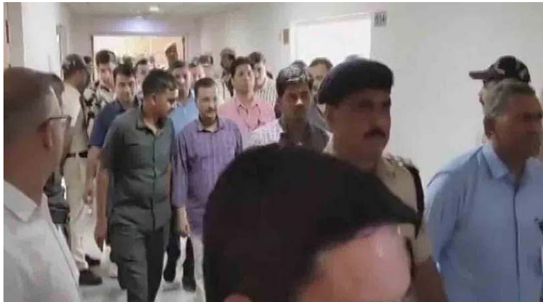
వద్ద పోలీసులు బందోబస్తు ఏర్పాటు చేశారు.