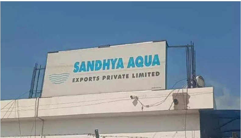
నిందితులను ఎప్పటికప్పుడు అరెస్టు చేస్తున్నామని చెప్పారు.