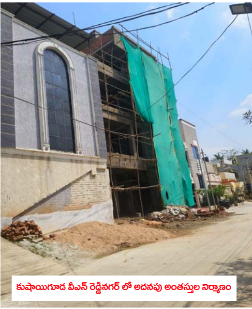
కుషాయిగుడ వీఎస్ రెడ్డినగర్ లో అదనపు అంతస్తుల నిర్మాణం