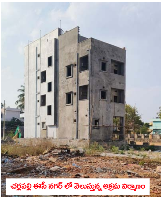
చర్లపల్లి కాసీ నగర్ లో వెలుస్తున్న అక్రమ నిర్మాణం

తెలంగాణ వీణ కాప్రా : కాప్రా సర్కిల్ పరిధిలోని పలు ప్రాంతాల్లో చేపడుతున్న అక్రమ నిర్మాణాలకు అడ్డు అడుపు లేకుండా పోయింది. కాప్రా.వి.ఎస్ రావునగర్, చర్లపల్లి, హెచ్ బి కాలనీ డివిజన్ లలో వెలుగుతున్న అక్రమ నిర్మాణాలు ఇష్టానుసారంగా వెలుస్తున్న అధికారులు చూసి చూడనట్లుగా వ్యవహరించడం పై పలు అనుమానాలు వ్యక్తం అవుతున్నాయి. పట్టణ ప్రణాళిక విభాగం సిబ్బంది అందినంత దండుకోని అక్రమ నిర్మాణాలకు ఆజ్ఞం పోస్తున్నారనే విమర్శలు వెల్లవెత్తుతున్నాయి.