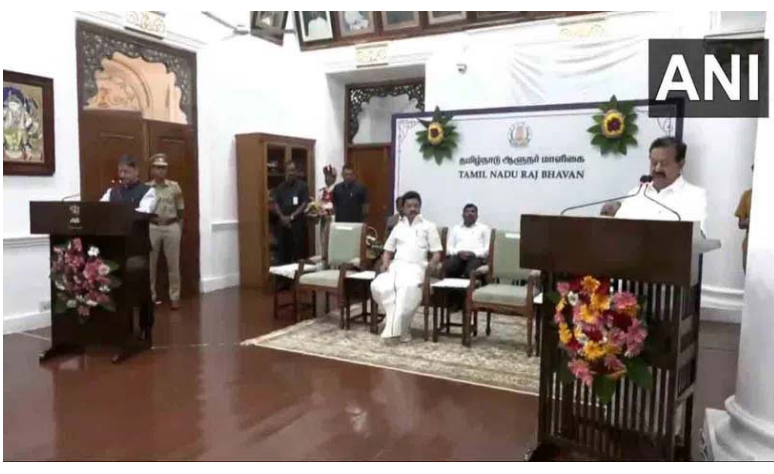
మంత్రిగా ప్రమాణ స్వీకారం చేయిస్తారని ఆయన తరపు న్యాయవాది కోర్టుకు తెలియజేశారు.

తమిళనాడు : తమిళనాడుకు చెందిన డీఎంకే నేత పొన్నుడి ఎట్టకేలకు మంత్రిగా ప్రమాణం చేశారు. పొన్నుడిని మంత్రిగా నియమించేందుకు నిరాకరిస్తూ వచ్చిన తమిళనాడు గవర్నర్ ఆర్ఎస్ రవి సుప్రీంకోర్టు బీచాట్లు పెట్టడంతో దిగొచ్చారు. శుక్రవారం సాయంత్రం ఆయన చేత ప్రమాణస్వీకారం చేయించారు. ఈ కార్యక్రమానికి తమిళనాడు ముఖ్యమంత్రి ఎంకే స్టాలిన్ కూడా హాజరయ్యారు. అక్రమాస్తులు కేసులో పొన్నుడికి గతంలో జైలుశిక్ష పడింది. దాంతో ఆయన ఎమ్మెల్యే సభ్యత్వం రద్దయింది. తమిళనాడు హైకోర్టు మాడేక్షన్ జైలుశిక్ష విధించింది. హైకోర్టు తీర్పును నవాల్ చేస్తూ పొన్నుడి సుప్రీంకోర్టును ఆశ్రయించడంతో.. సర్వోన్నత న్యాయస్థానం ఆయనకు హైకోర్టు విధించిన శిక్షను నిలిపివేస్తూ ఆదేశాలు ఇచ్చింది. దాంతో పొన్నుడి ఎమ్మెల్యేగా కొనసాగుతారని తమిళనాడు స్పీకర్ ప్రకటించారు. ఆ వెంటనే సీఎం స్టాలిన్ పొన్నుడి పేరును మంత్రిగా సిఫారసు చేశారు. అయితే అందుకు గవర్నర్ నిరాకరించారు. దాంతో స్టాలిన్ సుప్రీంకోర్టును ఆశ్రయించారు. స్టాలిన్ పిటిషన్ పై విచారణ జరిపిన సుప్రీంకోర్టు.. గవర్నర్ ఆర్ఎస్ రవికి గురువారం బీచాట్లు పెట్టింది. తాము ఇచ్చిన తీర్పును ధిక్కరిస్తున్నారని ఆగ్రహం వ్యక్తం చేసింది. శుక్రవారం సాయంత్రం లోపు పొన్నుడిని మంత్రిగా నియమించడంపై నిర్ణయం తీసుకోవాలని డెడ్లైన్ పెట్టింది. దాంతో గవర్నర్ ఆర్ఎస్ రవి దిగొచ్చారు. పొన్నుడిని మంత్రిగా నియమించేందుకు సమ్మతి తెలిపారు. కోర్టు తీర్పును ధిక్కరించాల్సే ఉద్దేశం తనకు లేదని చెప్పారు. గత పరిణామాల ఆధారంగానే తాను పొన్నుడితో మంత్రిగా ప్రమాణం చేయించలేదని వివరణ ఇచ్చారు. గవర్నర్ ఆర్ఎస్ రవి పొన్నుడితో