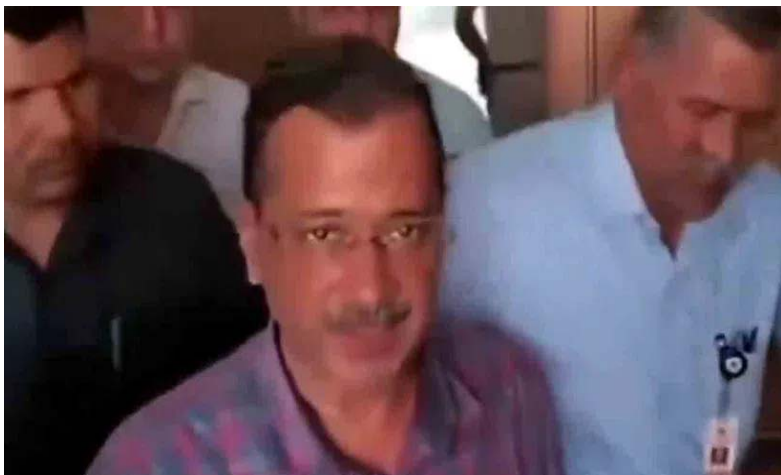
విచారణ నిమిత్తం కేజ్రీవాల్ను పది రోజులు కస్టడీకి కోరింది. ప్రస్తుతం వాదనలు కొనసాగుతున్నాయి. న్యాయమూర్తి తీర్పుపై ఉత్పంథ కొనసాగుతోంది.

న్యూఢిల్లీ : తన జీవితం దేశానికి అంకితం అని అన్నారూ ఢిల్లీ ముఖ్యమంత్రి, ఆమ్ ఆద్మీ పార్టీ చీఫ్ అరవింద్ కేజ్రీవాల్ మద్యం కుంభకోణం కేసులో ఈడీ అరెస్ట్ తర్వాత ఆయన తొలిసారి మాట్లాడారు. ఎక్కడ ఉన్నా దేశం కోసం పనిచేస్తుంటానని పేర్కొన్నారు. ఢిల్లీ మద్యం పాలసీ కేసులో ఎన్ఫోర్స్ మెంట్ డైరెక్టరేట్ ( అధికారులు కేజ్రీవాల్ను గురువారం రాత్రి అరెస్ట్ చేసిన విషయం తెలిసింది. ఈ నేపథ్యంలో శుక్రవారం మధ్యాహ్నం ఆయన్ని ఢిల్లీలోని రౌస్ అవెన్యూ కోర్టులో హాజరుపరిచారు. ఆ సమయంలో కేజ్రీవాల్ కోర్టు లోపలికి వెళ్లారు.. నా జీవితం దేశానికి అంకితం. లోపల ఉన్నా బయట ఉన్నా దేశం కోసం పనిచేస్తుంటా' అని పేర్కొన్నారు. ఆయనే కింగ్ పిన్. కేజ్రీ పాత్రను కోర్టుకు వివరించిన ఈడిమరోవైపు కేజ్రీవాల్ను ఈడీ పది రోజుల కస్టడీకి కోరింది. ఈ మేరకు మద్యం కుంభకోణంలో కేజ్రీవాల్ పాత్రపై కోర్టుకు వివరించింది. 28 పేజీల రిమాండ్ రిపోర్టును ఈడీ కోర్టు ముందు ఉంచింది. సొలిసిటర్ జనరల్ ఎస్పీ రాజు ఈడీ తరపున వాదనలు వినిపిస్తున్నారు. ఈ కేసులో కేజ్రీవాల్ కింగ్ పిన్ అని, మద్యం పాలసీ అమలులో ఆయన ప్రత్యక్షంగా పాల్గొన్నారని కోర్టుకు వివరించారు. 'మద్యం పాలసీ కేసులో కేజ్రీవాల్ కింగ్ పిన్. పాలసీ అమలులో ఆయన ప్రత్యక్షంగా పాల్గొన్నారు. ఇందులో సౌత్ గ్రూప్ నకు అనుకూలంగా వ్యవహరించారు. ఇది రూ.వంద కోట్ల స్వామ్ కాదు.. రూ.600 కోట్ల స్వామ్. ఇందులో కేజ్రీ వాల్కు రూ.300 కోట్లు అందాయి. పంజాబ్, గోవా ఎన్నికల్లో ఖర్చుపెట్టింది ఈ డబ్బే. రూ.45 కోట్లు హవాలా ద్వారా గోవాకు పంపారు. ఆమ్, సౌత్ గ్రూప్ ల మధ్య విజయ్ నాయర్ వారధిగా ఉన్నాడు. విజయ్ నాయర్ కంపెనీ నుంచి అన్ని ఆధారాలూ సేకరించాం. మా దగ్గర అన్ని ఆధారాలూ ఉన్నాయి' అని ఈడీ వివరించింది. ఈ కేసులో