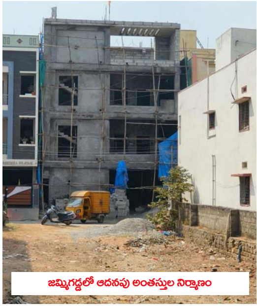
జమ్మగడ్డలో అదనపు అంతస్తుల నిర్మాణం

సర్కిల్ పరిధిలోనే విచ్చలవిడిగా అక్రమ నిర్మాణాలు కొనసాగుతున్న వ్యవస్థలకు లోపించడంతో నిబంధనలను ఉల్లంఘించి నిర్మాణాలు చేపడుతున్నారు. చర్లపల్లి డివిజన్ పరిధిలోని ఈసీనగర్, చక్రవర్తి, రెడ్డికాలనీ, వీఎస్ రెడ్డినగర్, కుషాయిగుడ ప్రాంతాల్లో నిబంధనలను అతిక్రమిస్తూ యథేచ్ఛగా నిర్మాణాలు చేపడుతున్నారు. దీంతో బాధితులకు అధిక ప్రభుత్వ ఆధారాలను గండ్పించుతున్న ఉన్నతాధికారులు పట్టణ పంచాయతీలో కేసులను స్థానిక ప్రజాప్రతినిధుల అందడందలు మొదలుగా ఉన్నాయని ఆరోపణలున్నాయి. సర్కిల్ వ్యాప్తంగా జోరుగా అక్రమ నిర్మాణాలు కొనసాగుతున్న నోటిసులతో చేతులు దులుపుకుంటున్నారని తప్ప ఎలాంటి చర్యలు తీసుకోవటం లేదని స్థానికులు విమర్శిస్తున్నారు. అక్రమ నిర్మాణాలను ఉపేక్షించి లేదంటూ ఆర్డారులు ప్రకటించి జారీ చేస్తున్నారనే తప్పు అమలు చేయటంలో పూర్తిగా విఫలమైతున్నారని పలువురు