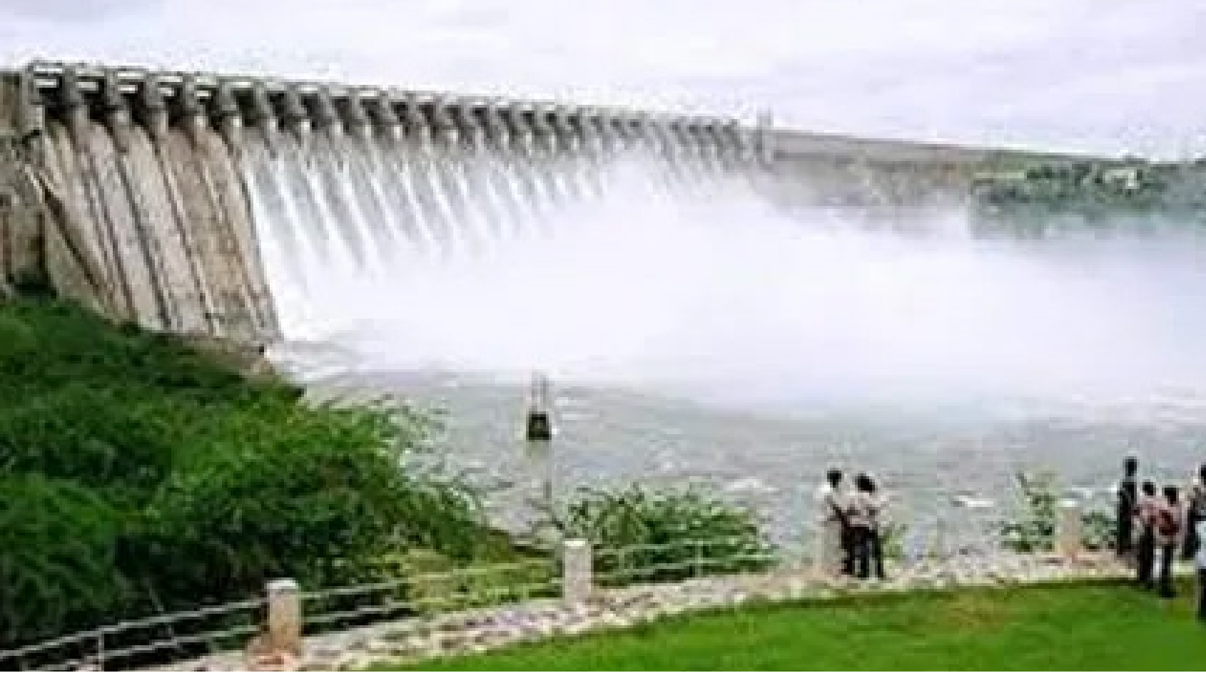
తెలంగాణవీణ, జగిత్యాల జిల్లా