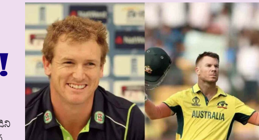
వెల్లడించాడు. రిటైర్మెంట్ యూటర్న్.. ఈమధ్యే వార్నర్ ఇన్ స్ట్రామ్ లో రిటైర్మెంట్ యూటర్న్ గురించి పోస్ట్ పెట్టిన విషయం తెలిసిందే. అందులో తన పునరామనం గురించిన ఆలోచనలు అతడు పంచుకున్నాడు. 'అధ్యాయం ముగిసింది.

'వార్నర్ రిటైర్ అయ్యాడని మాకు తెలుసు. అయితే.. సుదీర్ఘ కెరీర్ లో మూడు ఫార్మేట్ లో ఎన్నో ఘనతలు సాధించిన అతడిని సేము అభినందిస్తున్నాం. ఆస్ట్రేలియా క్రికెట్ కు వార్నర్ చేసిన సేవను కొనియాడుతున్నాం. కానీ, పాకిస్తాన్ లో జరుగబోయే ఛాంపియన్స్ ట్రోఫీలో వార్నర్ ఉండడు. ఎందుకంటే.. జట్టులోకి కొత్త ఆటగాళ్లు వస్తున్నారు. ఇక గైన్ మ్యాక్ క్వెల్, మిచెల్ మార్షెలు ఈ మెగా టోర్నీ ఎంతో కీలకం' అని బెయిలీ