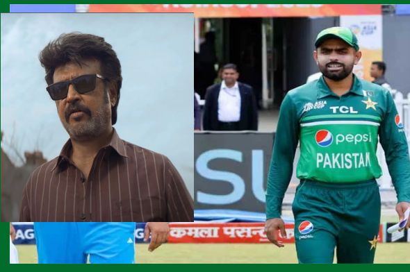
ఇంటర్వెల్ డెస్క్ వచ్చే ఏడాది పాకిస్తాన్ వేదికగా జరగనున్న ఛాంపియన్స్ ట్రోఫీ

( 2025)లో టీమ్ ఇండియా ఆడుతుందా? లేదా అనే దానిపై ఇంకా అనిశ్చితి కొనసాగుతూనే ఉంది. ఒక వేళ భారత్ రాకపోతే అందుకు బీసీబిఐ కారణాలు చెప్పాలని పీసీబీ అధికారికమైన డిమాండ్ ను చేయడం విచిత్రం. ఎనిమిది చేతులు పాల్గొనే ఈ మెగా టోర్నీ ఫిబ్రవరి 19 నుంచి మార్చి 9వ తేదీ వరకు జరగనుంది. టోర్నీ ప్రతిపాదిత షెడ్యూల్ ను కూడా పాకిస్తాన్ క్రికెట్ బోర్డు ఐసీసీకి అందించింది. భద్రతా, రవాణాపరమైన కారణాల రృష్ట్యా భారత జట్టును లాహోర్ లో గదాఫీ స్టేడియంలో ఆడేలా షెడ్యూల్ రూపొందించారు. అయినా, పాకిస్తాన్ కు వెళ్లేందుకు టీమ్ ఇండియా సుముఖంగా లేదు. భారత్ ఆడే మ్యాచ్ లను మాత్రం గతంలో ఆసియా కప్ జరిగినట్లు వేరే దేశంలో నిర్వహించాలని బీసీసీబి కోరుతున్నట్లు తెలుస్తోంది. టీమ్ ఇండియా మ్యూజింగ్ దుబాయ్ లేదా శ్రీలంకలో నిర్వహించాలని ఐసీసీబి బీసీసీబి వర్గాలు అడిగినట్లు సమాచారం. దీనిపై ఐసీసీబి ఇంకా ఎలాంటి నిర్ణయం తీసుకోలేదు. భారత ప్రభుత్వం నుంచి అనుమతి లభిస్తేనే టీమ్ ఇండియా పాకిస్తాన్ ను వెళ్లనుంది. "భారత ప్రభుత్వం అనుమతిని నిరాకరిస్తే అది రాతపూర్వకంగా ఉండాలి. ఆ లేఖను బీసీసీబి.. ఐసీసీబి తప్పనిసరిగా అందించాలి. టోర్నీ ప్రారంభానికి కనీసం 5-6 నెలల ముందు భారత జట్టు పాకీ పర్యటనకు సబంధించిన వివరాలను బీసీసీబి రాతపూర్వకంగా ఐసీసీబి తెలియజేయాలి. ఇందు కోసం మేం గట్టిగా పట్టుబడుతాం" అని పీసీబీ వర్గాలు పీటీఐతో పేర్కొన్నాయి.