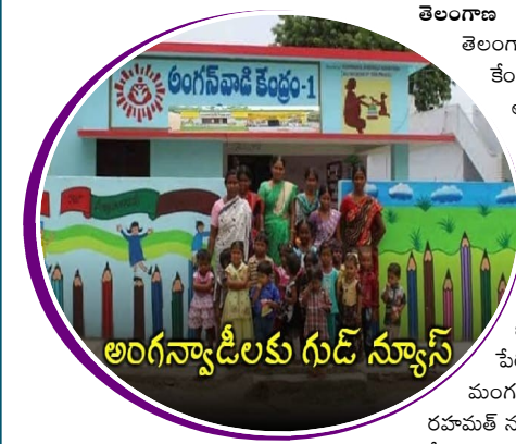
అంగన్వాడీలకు గుడ్ న్యూస్

తెలంగాణ వీణ, హైదరాబాద్, జూలై 16: తెలంగాణలోని అంగన్వాడీ కేంద్రాలలో పనిచేస్తున్న టీచర్లు, ఆయాలకు మంత్రి సీతక్క శుభవార్త ప్రకటించారు. ఇకపై పదవీ విరమణ చేసే సిబ్బందికి రిటైర్మెంట్ బెనిఫిట్స్ అందిస్తామని తెలిపారు. రెండు మూడు రోజులలో దీనికి సంబంధించి జీవో జారీ చేస్తామని పేర్కొన్నారు. ఈవేరకు మంగళవారం హైదరాబాద్లోని రహమత్ నగర్ లో జరిగిన 'అమ్మ మాట- అంగన్వాడీ బాట' కార్యక్రమంలో మంత్రి సీతక్క ఈ ప్రకటన చేశారు. రిటైర్మెంట్ బెనిఫిట్స్ కింద పదవీ విరమణ పొందే టీచర్ కు రూ. 2 లక్షలు, ఆయాలకు రూ. లక్ష చొప్పున తెలంగాణ ప్రభుత్వం అందజేయనుంది. నామమాత్రపు వేతనంతో సేవలందిస్తున్న అంగన్వాడీ సిబ్బంది కష్టాలు ప్రభుత్వానికి తెలుసని మంత్రి చెప్పారు. అంగన్వాడీ సిబ్బందికి ఇచ్చిన హామీని తమ ప్రభుత్వం నిలబెట్టుకుంటుందని, రెండు మూడు రోజుల్లో ఈవేరకు జీవో విడుదల చేస్తామని మంత్రి సీతక్క తెలిపారు.