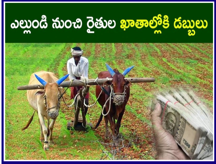
ఎల్లుండి నుంచి రైతుల ఖాతాల్లోకి డబ్బులు

తెలంగాణ వీణ, హైదరాబాద్, జూలై 16: జూలై 18నుంచి రైతులకు రుణమాఫీ చేస్తున్నామని సీఎం రేవంత్ రెడ్డి ప్రకటించారు. మొదట లక్ష లోపు రుణాలకు సంబంధించి రైతుల ఖాతాల్లో డబ్బులు వేస్తామని తెలంగాణ వ్యవసాయ శాఖ మంత్రి తుమ్మల నాగేశ్వర రావు చెప్పారు. మొదటి విడతగా రైతుల ఖాతాల్లోకి సుమారు 6వేల కోట్లు రూపాయలు జమ చేయనున్నట్లు తెలిపారు. లక్షకు పైగా రుణాలు ఉన్నవారికి మరో పదిరోజుల్లో వారి ఖాతాల్లో డబ్బులు జమ చేస్తామని తుమ్మల అన్నారు. మొత్తంగా ఆగస్టు 15 లోపు రుణమాఫీ చేస్తామని చెప్పారు. కుటుంబ నిర్ధారణ కోసమే రేషన్ కార్డు అని అన్నారు. పాత పద్ధతిలోనే కుటుంబానికి రెండు లక్షల రుణమాఫీ చేస్తామని స్పష్టం చేశారు. 60 లక్షల ఖాతాల్లో 6 లక్షల మందికి రేషన్ కార్డు లేదు. అలాంటి వారికోసం రేషన్ కార్డు లేకున్నా రుణమాఫీ చేస్తామని చెప్పారు. గత ప్రభుత్వ హయాంలో లక్ష రుణమాఫీ చేస్తామని ఇచ్చిన కొన్ని డబ్బులు వడ్డీకే సరిపోయాయన్నారు మంత్రి తుమ్మల నాగేశ్వరరావు. రెండు లక్షల రుణమాఫీ ఒకేసారి చేస్తుంటే బీఆర్ ఎస్ మామీద నిందలు వేస్తుందన్నారు. తెల్ల రేషన్ కార్డు అనేది కుటుంబ నిర్ధారణ కోసమే అన్నారు. దాదాపు 38 లక్షల కుటుంబాలు రుణాలు తీసుకున్నాయన్నారు. రుణమాఫీకోసం రూ. 31వేల కోట్లు ఖర్చు మంత్రి తుమ్మల అవుతుందన్నారు.