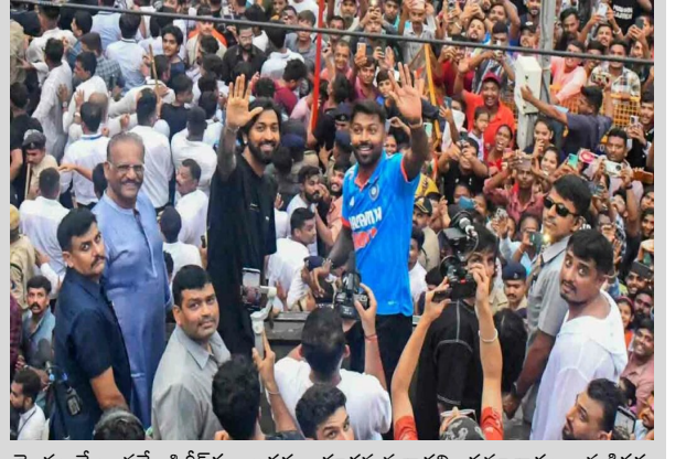
మొదలయ్యే వనే సిరీస్ కు అతడు దూరమవుతాడని సమాచారం. వ్యక్తిగత కారణాలతో పాండ్యా సిరీస్ నుంచి వైదొలగుస్తాడని టాక్.

పొట్టి వరల్డ్ కప్ హీరో హార్డిక్ పాండ్యా సొంత ఇలాకాలో అడుగుపెట్టాడు. బార్నెట్ నుంచి స్వదేశం వచ్చాక ముంబైలోనే ఉండిపోయిన పాండ్యా మంగళవారం బరోడాకు వెళ్లాడు. ఊహించిన దానికంటే రెట్టింపుగా ఈ స్టార్ ఆల్ రౌండర్ కు అభిమానులు ఘన స్వాగతం పలికారు. ఆ తర్వాత సోదరుడు కృనాల్ పాండ్యాతో కలిసి పాండ్యా ఓపెన్ టాప్ బస్సులో రోడ్ షో పాల్గొన్నాడు. ఓపెన్ టాప్ బస్సులో ఊరేగిన పాండ్యాకు జనం నీరాజనాలు పలికారు. దారి పొడవునా వరల్డ్ కప్ హీరోకు వెల్కమ్ చెప్పూ హార్డిక్, కృనాల్ లతో ఫోటోలు తీసుకున్నారు. అంతమంది తనల్లో చూపిస్తున్న ఆదరణ, ప్రేమకు ఫిదా అయిన పాండ్యా వాళ్లకు థాంక్యూ చెప్పాడు. టీ20 వరల్డ్ కప్ లో ఆల్ రౌండర్ గా విశేషంగా రాణించిన పాండ్యా.. పైసల్ ను కెప్టెన్ పాటు కోట్లాదిమందిని గెలిపించాడు. 20వ ఓవర్ లో దక్షిణాఫ్రికా విజయానికి 16 పరుగులు అవసరమైన వేళ బంతి అందుకున్న పాండ్యా.. తొలి బంతితే దేంజరన్ డేవిడ్ మిల్లర్ వికెట్ తీసి జట్టును గెలుపు వాకిట్ నిలిపాడు. ఒత్తిడిలోనూ కట్టుదిట్టమైన బౌలింగ్ తో అదరపూరి అనిపించాడు. అంతేకాదు ఐపీఎల్ 17వ సీజన్ లో తనను ఛీ క్యాప్టెన్ వాళ్లకు పాండ్యా గట్టి సమాధానం చెప్పాడు. శ్రీలంకతో జరగబోయే టీ20 సిరీస్ కు పాండ్యా కెప్టెన్ గా ఎంపికయ్యే అవకాశం ముంది. అయితే.. ఆగస్టు 2న