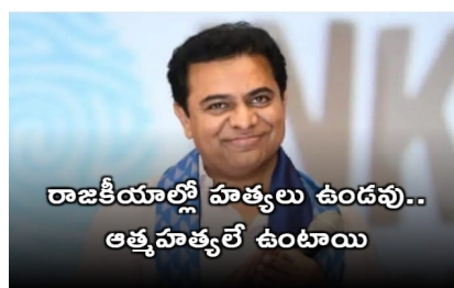
రాజకీయాల్లో హత్యలు ఉండవు.. ఆత్మహత్యలే ఉంటాయి

తెలంగాణ వీణ, హైదరాబాద్, జూలై 16: పార్టీ మారిన ఎమ్మెల్యేలు వారికి వారే ఆత్మహత్య చేసుకున్నారని వ్యాఖ్య ముఖ్యమంత్రి రేవంత్ రెడ్డి పాలనలో దారుణమైన పరిస్థితులు నెలకొన్నాయని బీఆర్ఎస్ వర్కింగ్ ప్రెసిడెంట్ కేటీఆర్ అన్నారు. పార్టీ మారాలంటూ బీఆర్ఎస్ ఎమ్మెల్యేలను బెదిరిస్తున్నారని మండిపడ్డారు. బీజేపీని వాషింగ్ మెషిన్ పార్టీగా కాంగ్రెస్ అభివృద్ధిం చిందని... ఇప్పుడు అదే పనిని కాంగ్రెస్ పార్టీ తెలంగాణలో చేస్తోందని విమర్శించారు. ఇతర రాష్ట్రాల్లో కాంగ్రెస్ ఎమ్మెల్యేలను బీజేపీ తీసుకుంటే మర్డర్ ఆఫ్ డెమోక్రసీ అంటున్నారని... ఇక్కడ మీరు చేస్తున్నది ఏమీటని అడిగితే సమాధానం లేదని చెప్పారు. బీఆర్