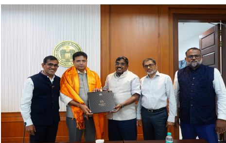
పరోక్షంగా మరో 1250 మందికి ఉపాధి దొరుకుతుందని వెల్లడించారు. జ్యూయెలరీ రంగంలో ఎంతో చరిత్ర ఉన్న మలబార్

తెలంగాణ వీణ/హైదరాబాద్,జూలై18: 'మలబార్' సంస్థ మహేశ్వరంలో ఏర్పాటు చేసిన బంగారం, వజ్రాభరణాల తయారీ యూనిట్ దేశంలోనే అతిపెద్దదని ఐటీ, పరిశ్రమల మంత్రి దుద్దిక్కి శ్రీధర్ బాబు వెల్లడించారు. మొదటి దశ నిర్మాణం పూర్తి చేసుకున్న ఈ ఉత్పాదన కేంద్రంపై ఇప్పటికే మలబార్ రూ.183 కోట్ల పెట్టుబడులు పెట్టిందని మంత్రి తెలిపారు. మూడేళ్లలో మొత్తం రూ.750 కోట్లు వెచ్చిస్తుందని చెప్పారు. గురువారం సచివాలయంలో మలబార్ గ్రూప్ ప్రతినిధులు శ్రీధర్ బాబుతో బేటీ అయ్యారు. ఏడాది వివర నాటికి 1500 మంది ఉద్యోగులతో అభరణాల తయారీ ప్రారంభమవుతుందని మంత్రి తెలిపారు.