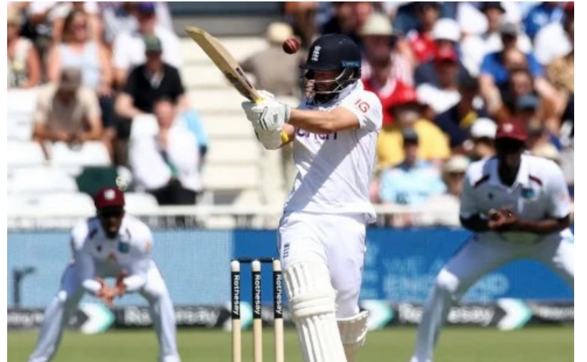
-5. ఇంగ్లండ్పై భారత్ (2008) - 5.3 ఓవర్లు. వెస్ట్ ఇండీస్పై భారత్ (2023) - 5.3 ఓవర్లు

హైదరాబాద్: టెస్టు క్రికెట్లో బ్యాట్ (దూకుడుగా బ్యాటింగ్) వ్యాహ్ని అనుసరిస్తున్న ఇంగ్లండ్ జట్టు నంచలన రికార్డు సృష్టించింది. నాటింగామ్ వేదికగా వెస్ట్ ఇండీస్ జరుగుతున్న రెండవ టెస్టు మ్యాచ్లో తొలుత బ్యాటింగ్ చేపట్టిన ఇంగ్లండ్ కేవలం 4.2 ఓవర్లలో 50 పరుగుల స్కోరును అందుకుంది. పవర్ హిట్టింగ్ జోడీ బెన్ డకెట్ ఒకటి పోస్ట్ దూకుడికి సునాయనంగా ఈ స్కోరుని చేరుకుంది. కాగా 147 ఏళ్ల టెస్టు క్రికెట్ చరిత్రలో ఒక జట్టు 27 బంతుల్లోనే 50 పరుగుల మార్కు చేరుకోవడం ఇదే తొలిసారిని గణాంకాలు చెబుతున్నాయి. 1994లో ఓవల్ మైదానంలో దక్షిణాఫ్రికాపై ఇంగ్లండ్ 4.3 ఓవర్లలో 50 పరుగులు చేరుగా.. ఇప్పుడు 26 బంతుల్లోనే 50 పరుగులు సాధించి తన రికార్డును తానే బద్దలు కొట్టింది. టెస్ట్ క్రికెట్లో వేగంగా 50 రన్స్ సాధించిన జట్టు ఇవే.. 1. వెస్ట్ ఇండీస్పై ఇంగ్లండ్ (2024) - 4.2 ఓవర్లు. 2. దక్షిణాఫ్రికాపై ఇంగ్లండ్ (1994) - 4.3 ఓవర్లు. 3. శ్రీలంకపై ఇంగ్లండ్ (202) - 4.6 ఓవర్లు. 4. పాకిస్తాన్పై శ్రీలంక (2004) - 5.2 ఓవర్లు.