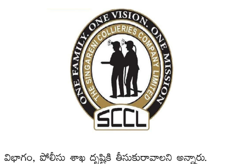
విభాగం, పోలీసు శాఖ దృష్టికి తీసుకురావాలని అన్నారు.

ముందు పరీక్ష కేంద్రానికి చేరుకోవాలని తెలిపారు. ఇక పరీక్షా కేంద్రంలో బయోమెట్రిక్ విధానంలో అభ్యర్థుల పరీక్షకు ముందు, తర్వాత వారి బయోమెట్రిక్ వివరాలు సేకరించడం జరుగుతుందని వివరించారు.ఇక పోటీ పరీక్షల నిర్వహణలో అపార అనుభవం ఉన్న కేంద్ర ప్రభుత్వ రంగ సంస్థ ఈడీసీఎల్ వారి ఆధ్వర్యంలోనే పరీక్షలను నిర్వహిస్తున్నట్లు వెల్లడించారు. ఇందుకోసం హైదరాబాద్ జంటనగరాల్లోని 12 పరీక్షా కేంద్రాల్లో ఈ పరీక్షలను నిర్వహించేందుకు ఏర్పాట్లు చేసినట్లు తెలిపారు. అలాగే మోసగాళ్ల వలలో పడవద్దని, కష్టాన్ని సమ్ముకుని పరీక్షలో విజయం సాధించాలని సూచించారు. ఎవరైనా మారుమాటలు చెప్పి మోసం చేసేందుకు ప్రయత్నిస్తే వారి వివరాలను సంస్థ విజిలెన్స్