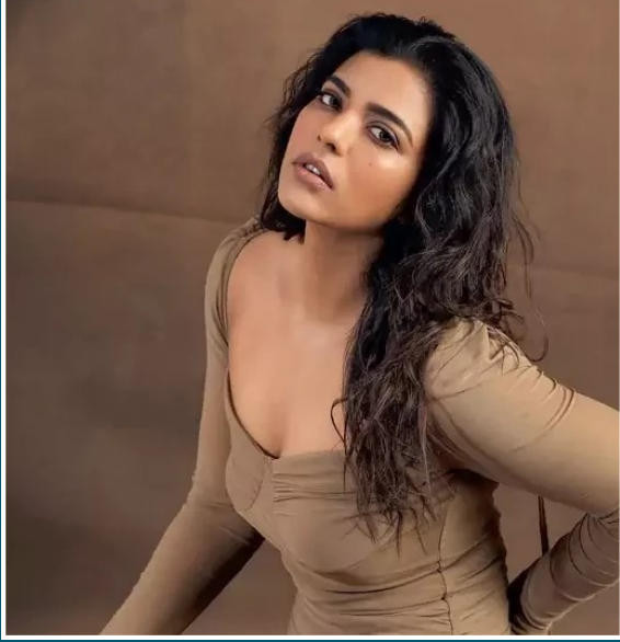
'నువ్వు ఏం చూస్తున్నావన్నది ముఖ్యం కాదు. నువ్వు ఏం చూశావన్నదే ముఖ్యం' అంటోంది ఐశ్వర్య రాజేక్ ఎప్పుడూ ఫ్యాషన్ దుస్తుల్లో కనిపించే శ్రద్ధాకపూర్ తాజాగా చీరకట్టులో మెరిసింది. సూర్యాస్తమయం ఎంతో బాగుంటుందంటోంది హ్యూమా ఖురేషి ఈ ఫోటోను తీసిన వారికి ధన్యవాదాలంటూ లేటెస్ట్ స్టిల్ను సభా