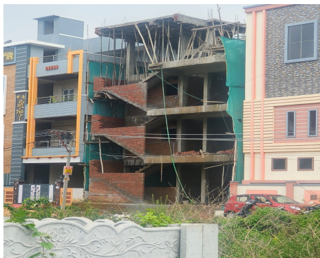
పద్మశాలి టౌన్ షిప్ లో వెలుస్తున్న అదనపు అంతస్తుల నిర్మాణం

తెలంగాణవీణ, కాప్రా: కాప్రా సర్కిల్ పరిధిలోని పలు ప్రాంతాల్లో యధేచ్ఛగా అక్రమ నిర్మాణాలు కొనసాగుతున్నా అధికారులు పట్టించుకోవటం లేదని స్థానికులు విమర్శిస్తున్నారు. కాప్రా, ఎఎస్ రావునగర్, చర్లపల్లి, మీర్సేట్ హెచ్చికాలనీ, మల్లాపూర్, నాచారం డివిజన్ ల పరిధిలోని నిబంధనలకు విరుద్ధంగా అక్రమనిర్మాణాలు జోరుగా కొనసాగుతున్నాయి. తీసుకున్న అనుమతులకు చేపడుతున్న నిర్మాణాలకు ఏలాంటి పొంతన లేకుండా విచ్చల విడిగా నిర్మాణాలు చేపడుతున్నారు. ప్రధాన రహదారుల పక్కనే పాత భవనాలపై అదనపు అంతస్తుల నిర్మాణాలు చేపడుతున్నా అధికారులు ప్రేక్షక పాత్ర వహిస్తున్నారనే ఆరోపనలున్నాయి. ఇందుకు స్థానిక ప్రజాప్రతినిధులు, అధికారులు నిర్మాణదారులతో చేతులు కలిపి మున్సిపల్ ఆదాయానికి గండి కొడుతున్నారనే విమర్శలు వినిపిస్తున్నాయి. అన్ని తామే చూసుకుంటామని