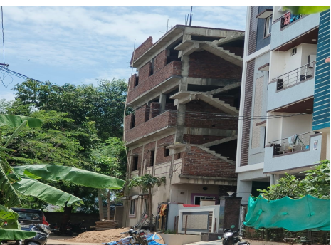
చర్లపల్లి డివిజన్లో పాత భవనంపై వెలుస్తున్న అదనపు అంతస్తుల నిర్మాణం

తెలంగాణవీణ, కాప్రా: కాప్రా సర్కిల్ పరిధిలోని పలు ప్రాంతాల్లో యధేచ్ఛగా అక్రమ నిర్మాణాలు కొనసాగుతున్నా అధికారులు పట్టించుకోవటం లేదని స్థానికులు విమర్శిస్తున్నారు. కాప్రా, ఎఎస్ రావునగర్, చర్లపల్లి, మీర్సేట్ హెచ్చికాలనీ, మల్లాపూర్, నాచారం డివిజన్ ల పరిధిలోని నిబంధనలకు విరుద్ధంగా అక్రమనిర్మాణాలు జోరుగా కొనసాగుతున్నాయి. తీసుకున్న అనుమతులకు చేపడుతున్న నిర్మాణాలకు ఏలాంటి పొంతన లేకుండా విచ్చల విడిగా నిర్మాణాలు చేపడుతున్నారు. ప్రధాన రహదారుల పక్కనే పాత భవనాలపై అదనపు అంతస్తుల నిర్మాణాలు చేపడుతున్నా అధికారులు ప్రేక్షక పాత్ర వహిస్తున్నారనే ఆరోపనలున్నాయి. ఇందుకు స్థానిక ప్రజాప్రతినిధులు, అధికారులు నిర్మాణదారులతో చేతులు కలిపి మున్సిపల్ ఆదాయానికి గండి కొడుతున్నారనే విమర్శలు వినిపిస్తున్నాయి. అన్ని తామే చూసుకుంటామని