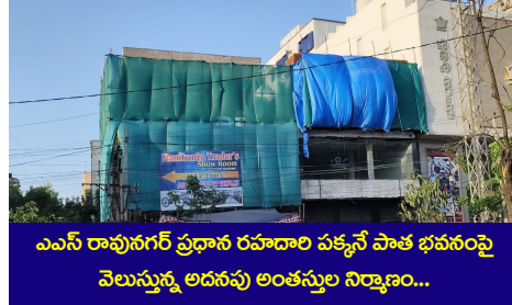
ఎఎస్ రావునగర్ ప్రధాన రహదారి పక్కనే పాత భవనంపై వెలుస్తున్న అదనపు అంతస్తుల నిర్మాణం...

కొందరు దళారులు నిర్మాణదారులతో కుమ్ముకై అందినకాడికి దండుకుంటూ అదనపు అంతస్తుల నిర్మాణాలకు కొమ్ముకాస్తున్నా అధికారులు పట్టించుకోకపోవటం శోచనీయం. కొందరు అధికారులను తమ గుప్పెట్లో పెట్టుకుని తమకు అనుకూలంగా మలుచుకుంటూ చక్రం తిప్పుతున్నారు. మౌలాలి హెచ్చికాలనీ ప్రధాన రహదారి పక్కనే బహుళ అంతస్తుల నిర్మాణాలు, సెల్లార్ తవ్వకాలతో పాటు అదనపు అంతస్తుల నిర్మాణాలపై స్థానిక ప్రజాప్రతినిధి అండదండలు మెండుగా ఉండటం వల్లే అక్రమ నిర్మాణాలు జోరుగా సాగుతున్నాయి. సర్కిల్ పరిధిలో అక్రమ నిర్మాణాలకు హద్దు అదుపు లేకుండా పోతోంది. పట్టణ ప్రణాళికాధికారి అక్రమ నిర్మాణాలపై చర్యలు తీసుకోకుండా నిర్లక్ష్యంగా వ్యవహరిస్తున్నారని స్థానికులు ఆరోపిస్తున్నారు. జిహెచ్ఎంసి నియమనిబంధనలను తుంగలో తొక్కి అధికారులు ప్రభుత్వానికి బారీ గండి కొడుతున్నారని పలువురు ఆరోపిస్తున్నారు. ఇంటి అనుమతులు తీసుకొని కమర్షియల్ నిర్మాణాలు చేపడుతున్నారని స్థానికులు ఆరోపిస్తున్నారు. అక్రమ నిర్మాణం పై స్థానికులు పలు మార్లు ఫిర్యాదులు చేసిన స్పందించకపోవడం విద్వేషంగా మారిందని, అక్రమ