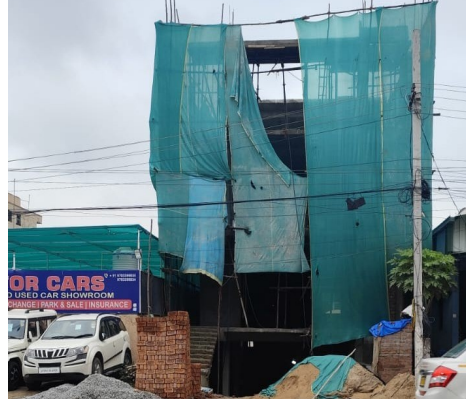
హెచ్చికాలనీ డివిజన్ లో వెలుస్తున్న నిర్మాణం

నిర్మాణదారులకు ప్రజాప్రతినిధుల అండదండలు వుప్పలంగా ఉండడంతో పూర్తిస్థాయిలో అవినీతి పాల్పడుతున్నారని స్థానికులు ఆగ్రహం వ్యక్తం చేస్తున్నారు. ఇప్పటికైనా ఉన్నతాధికారులు స్పందించి సర్కిల్ పరిధిలో కొనసాగుతున్న అక్రమ నిర్మాణాలపై తగిన చర్యలు తీసుకోవాలని స్థానికులు విజ్ఞప్తి చేస్తున్నారు.