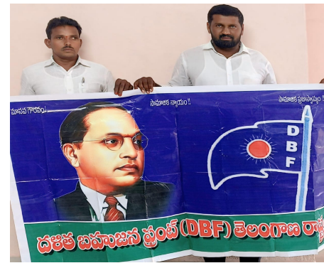
లో సినీయర్ దళిత నాయకులు చంద్రం పాల్గొన్నారు.

కార్డులు రాకపోవడం వలన ప్రభుత్వ పరంగా వచ్చే పథకాలకు దళిత, బహుజనులు అనర్హులుగా మిగిలిపోతున్నారు గనుక వెంటనే రేషన్ కార్డు జారిపక్రియ కొనసాగి విధంగా చేయాలన్నారు. రైతు రుణమాఫీ పక్రియలో ఎటువంటి నిబంధనలు పెట్టకుండా ప్రతి రైతుకు పాసు బుక్ ప్రామాణికంగా అమలుచేయాలన్నారు. బి ఆర్ ఎస్ ప్రభుత్వం హయాంలో 29.144 కొట్ల మాత్రమే రుణమాఫీ చేశారు కాని కాంగ్రెస్ ప్రభుత్వం 8 మాసాలలోనే 31 వేల కొట్ల రుణమాఫీ చేశారని చెబుతున్న ప్రభుత్వం గత ప్రభుత్వానికి అదర్తంగా ఉండాలంటే రుణమాఫీని శరతులు లేకుండా అమలు చేయాలని కొరుతున్నాం. రాష్ట్రంలో ఎస్సీ, ఎస్టీ లపై రొజుకొ దగ్గర దాడులు, దౌర్జన్యాలు కొనసాగుతున్నందున, నిరుద్యోగ సమస్యలు పరిష్కరించడానికి, కాంటి బద్రతలకు అటంకం లేకుండా ఉండటానికి సాంఘిక సంక్షేమ మంత్రిని, విద్యాశాఖ మంత్రిని, హెంబుల మంత్రిలను కేటాయించాలన్నారు. ఈ కార్యక్రమం