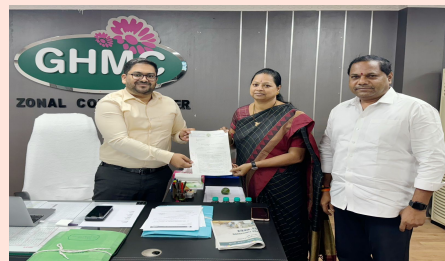
చిల్కానగర్ డివిజన్ అభివృద్ధికి నిధులు కేటాయింపులని జోనల్ కమిషనర్ కు కమిషనర్లు కార్యారంభం

తెలంగాణ వీణ, ఉప్పల్: చిల్కానగర్ డివిజన్ కార్యారంభం జరిగింది. కమిషనర్లు నిధుల కేటాయింపులను చూస్తున్నారు. డివిజన్ లోని విద్యార్థులను చూస్తున్న కమిషనర్లు.