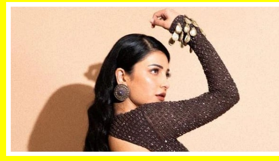
కెరీర్ లాంగ్ రన్ అంటే ఎలా ఉంటుందో తెలుసా? మమ్మల్ని అడగండి మేం చెబుతాం అంటున్నారు త్రిష అండ్ నయన్. వారిద్దరి కోవలోకే లేటెస్ట్ గా ఎంట్రీ ఇచ్చారు (శుతిహాసన్, అంజలి అండ్ అదర్బ్..ఇన్నేళ్ల కెరీర్లో ఈ