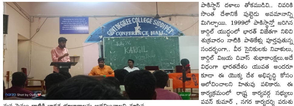
మన సైన్యం ధాటికి భారత భూభాగాలను ఆక్రమించాలని చూసిన