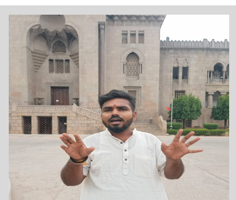
పునరాలోచించుకుని విద్యా రంగానికి సరిపడా నిధులు కేటాయించాలని ఏబీవీపీ డిమాండ్ చేస్తుంది లేని యెడల విద్యార్థి

2024 -2025 లో విద్యారంగానికి కేవలం 7.5 శాతం నిధులు కేటాయించడం చాలా బాధాకరం .విద్యారంగం బలోపేతం చేయదానికి కనీసం 30 శాతం నిధులు కేటాయించాలి . ఈ అరకొర బడ్జెట్తో విద్యారంగం నిర్వీర్యం అవుతుంది. గత ప్రభుత్వం బీఆర్ఎస్ హయంలో కూడా విద్యారంగ పూర్తిగా నిర్వీర్యం అయ్యింది. కనీసం ఈ ప్రభుత్వం లోనైనా విద్యారంగం బలోపేతం అయితుందని అనుకుంబే పూర్తిగా అంధకారంలోకి నెట్టేసే విధంగా చాలీచాలని నిధులు కేటాయించడం ఈ ప్రభుత్వ ఒంటెద్దు పోకూడదు నిలువెత్తు నిదర్శనం. ఇప్పటికైనా ప్రభుత్వం పరిషత్ ఈ ప్రభుత్వానికి బుద్ధి చెప్పదానికి సిద్ధంగా ఉంది.