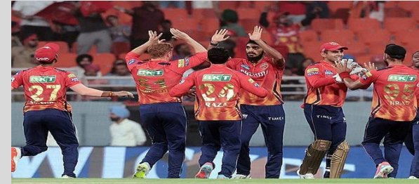
ఆశించిన మేర ఫరితాలు సాధించలేక పోయింది. జాఫర్ కొత్త కోచ్గా నియమితులైతే.. జట్టులో మార్పులు తీసుకువస్తాడని యాజమాన్యం భావిస్తోంది. మరోవైపు ఐపీఎల్ 2025 మెగా వేలానికి ముందు బీసీసీఐ పది జట్ల ప్రతినిధులతో 31న భేటీ కానుంది. ఎంత మంది ఆటగాళ్లను అట్టిపెట్టుకుంటారు, ఎంత మందిని వదిలేస్తారు తదితర విషయాలపై చర్చించనుంది.

ఇంటర్నెట్ డెస్కే: ఇప్పటివరకూ ఐపీఎల్లో టైటిల్ గెలవని జట్లలో పంజాబ్ కింగ్స్ ఒకటి. ఈ జట్టుకు పలువురు కెప్టెన్లు మారినా.. తలరాత మాత్రం మారడం లేదు.దీంతో కొత్త కోచ్గా మాజీ ఆర్పీబీ బ్యాటర్ను తీసుకోవాలని ఆ జట్ట యోచిస్తోందట. మాజీ టీమ్ఇండియా ఆటగాడు వసీం జాఫర్ ఆ జట్టు హెడ్ కోచ్గా నియమితులయ్యే అవకాశం ఉన్నట్లు తెలుస్తోంది. జట్టుతో టైవర్ బేలిస్ రెండేళ్ల కాంటాక్ట్ ముగియనుంది. ఈ నేపథ్యంలో కొత్త కోచ్ కోసం ఆ జట్టు వేట మొదలుపెట్టింది.ఇక జాఫర్ హెడ్కోచ్గా నియమితులైతే.. ఆ టీమ్తో కలిసి పనిచేయడం అతడికిది మూడోసారి అవుతుంది. గతంలో 2019-21 మధ్య బ్యాటింగ్ కోచ్గా వ్యవహరించాడు. ఇక ఐపీఎల్లో గత కొన్ని సీజన్లుగా పంజాబ్ కింగ్స్ ప్రదర్శన పేలవంగా ఉంటోంది. 2014 తర్వాత ఒక్కసారి కూడా ఆ జట్టు ప్లేఆఫ్స్ చేరలేదు. గత సీజన్లో 9వ స్థానంతో సరిపెట్టకుంది. అయితే.. ఈడెన్ గార్డెన్స్లో కోల్కతాను ఓడించి 262 పరుగుల అత్యధిక స్కోరును ఛేదించిన జట్టుగా మాత్రం రికార్డు సృష్టించింది.ఇక కేకేఆర్ రెండు ట్రోఫీలు నెగ్గడం వెనక బేలిస్ వ్యూహాలు కూడా ఉన్నాయి. అయితే.. అతడి మార్గదర్శకత్వంలో పంజాబ్