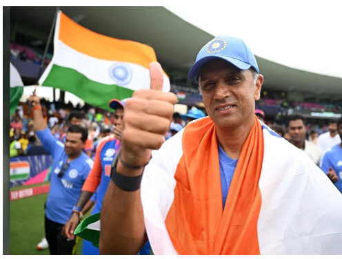
అనుసరించాయి. కానీ, ద్రవిడ్ ఇంకా ఎవరికీ ఓకే చెప్పలేదు. ద్రావిడ్ స్థానంలో కేకేఆర్ మాజీ మెంటార్ గౌతమ్ గంభీర్ భారత జట్టులోకి వచ్చాడు. ద్రవిడ్ అంతకుముందు 2014లో రాజస్థాన్

తీమిండియా మాజీ హెడ్ కోచ్ రాహుల్ ద్రవిడ్ కోచ్ పదవి నుంచి వైదొలగినప్పటి నుంచి ఇప్పటి వరకు అతనికి కొత్త ఉద్యోగం రాలేదు. ద్రవిడ్ కోచ్ లో డి20 ప్రపంచకప్ 2024 ఫైనల్లో తీమిండియా దక్షిణాఫ్రికాను ఓడించింది. ఇటువంటి పరిస్థితిలో, ఇప్పుడు క్రీకెట్ నివేదిక ప్రకారం, రాహుల్ ద్రవిడ్ రాజస్థాన్ రాయల్స్ కోచ్ కావచ్చు అని తెలుస్తోంది. శ్రీలంక దిగ్గజ క్రీకెటర్ కుమార సంగక్కర్ స్థానంలో భారత మాజీ క్రీకెటర్ ఇక్కడ చోటు దక్కించుకున్నాడు. సంగక్కర్ ఇప్పుడు అంతర్జాతీయ క్రీకెట్లో తన బాధ్యతలను వదులుకోవాలని అవకాశం ఉన్నందున ఇది జరుగుతుంది. ఇంగ్లండ్ క్రీకెట్ బోర్డు ఇక్కడ కుమార సంగక్కర్కు ప్రధాన కోచ్ బాధ్యతను ఇవ్వవచ్చు. గత నెలలో, జట్టు కోచ్ మాథ్యూ వేడ్ ఈ పదవిని విడిచిపెట్టాడు. ఇటువంటి పరిస్థితిలో, ఇప్పుడు ఈ పోస్ట్ పూర్తిగా ఖాళీగా ఉంది. సంగక్కర్ ప్రస్తుతం రాజస్థాన్ రాయల్స్ క్రీకెట్ డైరెక్టర్ గా పనిచేస్తున్నారు. రాజస్థాన్ రాయల్స్ లో ద్రవిడ్ చేరే ఛాన్స్.. తీమిండియా కోచ్ పదవి నుంచి ద్రవిడ్ వైదొలగిన వెంటనే.. చాలా ప్రాంతజిలు అతనిని