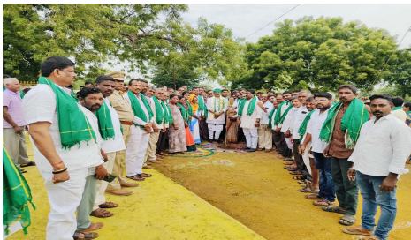
జరిగిందని, సీజనల్ వ్యాధుల పట్ల ప్రజలందరూ అప్రమత్తంగా ఉండాలని దోమల నివారణ పట్ల కృషి చేయాలని కోరారు. ఈ