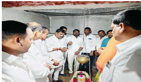
కార్యక్రమంలో ప్రజా ప్రతినిధులు, అధికారులు ప్రజలు, కాంగ్రెస్ పార్టీ నాయకులు, కార్యకర్తలు, తదితరులు పాల్గొన్నారు..