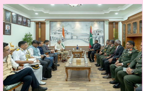
రోజులపర్యటనలో భాగంగా ఆగస్టు 11వరకు అక్కడే ఉండనున్న

- అధ్యక్షుడు మొహమ్మద్ ముయిజుజుతో భేటీ తెలంగాణ వీణ/స్వాధీల్లి, ఆగస్టు 10: మాల్దీవుల పర్యటనలో ఉన్న భారత విదేశాంగ మంత్రి ఎన్ జైశంకర్.. ఆ దేశ అధ్యక్షుడు మొహమ్మద్ ముయిజుజుతో భేటీ అయ్యారు. ఈ సందర్భంగా వారిద్దరూ అనేక అంశాలపై చర్చలు జరిపారు. మూడు