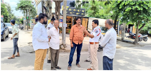
వాల్చిన చర్యల పై, అధికారులతో కలిసి పరిశీలించడం జరిగిందని పేర్కొన్నారు. ట్రాఫిక్ రద్దీ ఎక్కువగా ఉండే రోడ్లలో అక్రమణల తొలగింపుపై కఠిన చర్యలు తీసుకునే విధంగా పలు సూచనలు