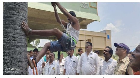
బిక్రం. నరసింహ.వెంకటేశ్ తోటరాజు జిల్లాలోని వివిధ మండలాల గీత కార్మికులు. ఎక్సైజ్ సిబ్బంది అధిక సంఖ్యలో పాల్గొన్నారు.