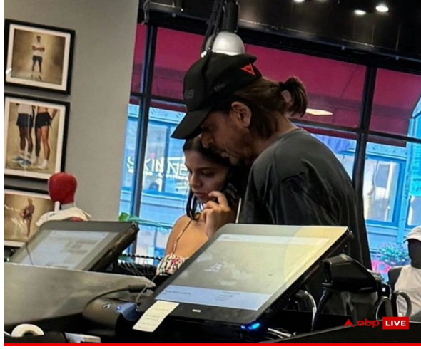
పరిశ్రమకు ఆయనందించిన సేవలకుగాను షారుఖ్ పార్ట్ అల్టా కెరీయరా అవార్డును అందుకున్నారు. ఇలాంటి గౌరవాన్ని పొంది చరిత్ర సృష్టించిన మొదటి భారతీయ నటుడిగా షారుఖ్ ఖాన్ నిలిచారు. సినిమాలో విషయానికొస్తే.. సుజోయ్ ఘోష్ దర్శకత్వంలో షారుఖ్ 'కింగ్'లో నటించనున్నారు.

బాలీవుడ్ హీరో షారుఖ్ ప్రపంచవ్యాప్తంగా అభిమానులను సొంతం చేసుకున్నారు. తాజాగా 77వ లోకార్స్ ఫిల్మ్ ఫెస్టివల్లో ప్రతిష్టాత్మకమైన పార్ట్ అల్టా కెరీయరా అవార్డును అందుకొని అందరి దృష్టిని ఆకర్షించారు. స్విట్జర్లాండ్ వేదికగా ఈ ఈవెంట్ జరిగింది. అక్కడి మీడియాతో మాట్లాడుతూ షారుఖ్ చేసిన వ్యాఖ్యలు ప్రస్తుతం అందరినీ ఆకట్టుకుంటున్నాయి. 'నా గురించి తెలియకపోతే గూగుల్ ను అడగండి. అది ఏం చెబుతుందో విని నన్ను ప్రశ్నలు అడగండి' అని షారుఖ్ సరదాగా అన్నారు. ఈ వ్యాఖ్యలపై గూగుల్ తన అధికారిక వెబ్సైట్ ఖాతాలో స్పందించింది. మీరు కింగ్ అనే అర్థం వచ్చేలా కిరీటం ఎమోజీని పోస్ట్ చేసి షారుఖ్ ను ట్యాగ్ చేసింది. దీనిపై అభిమానులు ఆసక్తికర కామెంట్స్ చేస్తున్నారు. 'సిని పరిశ్రమకు మీరు కింగ్' అని ఓ నెటిజన్ కామెంట్ చేయగా.. 'మీరు కింగ్ అని గూగుల్ కు కూడా తెలుసు' అని మరో అభిమాని అన్నారు. ఈ ఈవెంట్లో షారుఖ్ మాట్లాడుతూ.. దక్షిణాది చిత్రపరిశ్రమపై ప్రశంసలు కురిపించారు. 'సాత్ ఇండస్ట్రీలో ప్రతిభావంతుడైన వారున్నారు. గొప్ప కథలను తెరకెక్కిస్తున్నారు. భారతీయ సినిమాలో గొప్ప సూపర్ స్టార్లు చాలా మంది సాత్ నుంచి వచ్చిన వారే. అక్కడి వారితో కలిసి నేను పనిచేశాను. ఎక్కువ మంది దర్శకులతో కలిసి వర్క్ చేయాలని ఆసక్తిగా ఉన్నాను. ఎందుకంటే సాత్ ఇండస్ట్రీ ఎప్పుడూ ప్రత్యేకమే. మణిరత్నం దర్శకత్వంలో 'దిల్ సే'లో నటించాను. ఇంతకు మించి నాకు ఇంకేం కావాలి. 'బాహుబలి', 'అర్ అర్ అర్', 'జవాన్' వంటి చిత్రాలు ఇండియన్ సినిమాను మరో స్థాయికి తీసుకెళ్లాయి. భారీ బడ్జెట్ చిత్రాలను రూపొందించడంలోనూ దక్షిణాది పరిశ్రమ ముందుంటుంది' అని చెప్పారు. చిత్ర