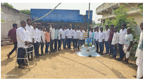
గర్జించిన మన్మం వీరుడు అల్లూరిని, స్వాతంత్ర్యం నాజన్య హక్కు అని నినదించిన లోకమన్యుడిని స్వరాజ్యం కోసం పోరాడిన వీర నారీమణి రూపాన్ని లక్ష్మీభాయ్, చెన్నమ్మ అనిబిసెంట్ సుచేతా

తెలంగాణ వీణ/సిద్దిపేట జిల్లా: చేరాల మండలం చుంచనకోట గ్రామ అంబేద్కర్ యువజన సంఘం ఆధ్వర్యంలో స్వాతంత్ర్య దినోత్సవ సందర్భంగా జండాకార్యక్రమం ఎగరవేసి నిర్వహించడం జరిగింది ఎందరోవీరుల త్యాగ ఫలం రెవరెవలాడే మువ్వనైల జెండా నీడన స్ఫుర్తించి భారతమాత ముద్దుబిడ్డల త్యాగ నిరతిని మరిచి పోగలమా క్షిణ్ణి ఇండియా ఉద్యమాన్ని ఉప్పు సత్యాగ్రహాన్ని జలియన్ వాలాబాగ్ ఉదంతాన్ని అహింసా వాదంతో అంగీయులను వడికించి భారతావనిని ఏకతాటిపై నిలిపిన గాంధీజీని ఆజాద్ హిందు ఫౌజ్ దశాన్ని నిర్మించి శత్రువులకు సింహస్వప్నమైన నేతాజీని, ఉరికొయ్యలను ముద్దాడిన భగత్ సింగ్ ని సిన్హ్ రద్దు కోసం బ్రిటీష్ ప్రభుత్వంతో పోరాడిన వీర పాంధ్య కట్టలహృణిని, అంగీయుల గుండెలపై బాణాలతో