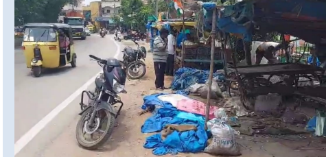
తెలంగాణ వీణ/కాప్రా: కాప్రా సర్కిల్ పరిధిలోని ప్రధాన రహదారులకు ఇరువైపుల ఫుట్ పాత్ లు ఆక్రమణకు గురవుతున్నాయి. దీంతో ఇక్కడి రహదారి నుంచి వచ్చిపోయే ప్రయాణికులు తీవ్ర అసౌకర్యానికి గురవుతున్నారు. కాప్రా