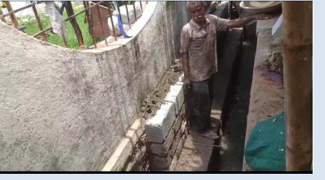
నానా ఇబ్బందులు ఎదుర్కొంటున్నారు. దీనికి తోడు రోడ్డును, నాలాలను ఆక్రమించుకుని వ్యాపారులు ఆవాసాలు ఏర్పాటు చేసుకుంటున్నారు. కుషాయిగూడ ప్రాథమిక ఆరోగ్యకేంద్రం పరిసరాల్లో రోడ్డును కట్టా చేసి వ్యాపారులు కొనసాగిస్తున్నా అధికారులు మాత్రం పట్టించుకోవటం లేదు. ట్రాఫిక్, మున్సిపల్ అధికారులు సమన్వయంతో రహదారులకు ఇరువైపుల ఉన్న ఫుట్ పాత్ లను నియంత్రించగలిగితే కొంతమేరకు ట్రాఫిక్ సమస్యకు పరిష్కారం లభిస్తోందని పలువురు ప్రయాణికులు అభిప్రాయపడుతున్నారు. కాగా కుషాయిగూడ మెయిన్ రోడ్ లోని నాలా కట్టా చేసి నాలా లోపల నుండి గోడ నిర్మాణం చేసి స్టాబ్ నిర్మాణం చేపడుతుంటే కుషాయిగూడ వెల్సీ అసోసియేషన్ సభ్యులు అభ్యంతరాలు వ్యక్తం చేస్తున్నారు. ఇక్కడి రోడ్డుపైన నెలకొన్న నిర్మాణాలు శాశ్వతంగా తొలగించాలని ట్రాఫిక్ పోలీసులకు, మున్సిపల్ టౌన్ ప్లానింగ్ అధికారులను కోరుతున్నారు. రోడ్డుకు ఇరువైపుల వెలుస్తున్న షెడ్డును తొలగించాలని కుషాయిగూడ వెల్సీ అసోసియేషన్ సభ్యులు కోరుతున్నారు.