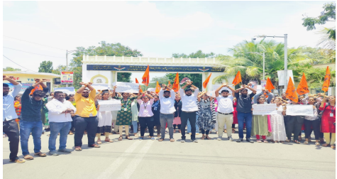
తెలంగాణ వీణ/ఓయూ: అఖిల భారతీయ విద్యార్థి పరిషత్ ఉస్మానియా యూనివర్సిటీ శాఖ ఆధ్వర్యంలో ఎంసీసీ గేట్ వద్ద నిరసన కార్యక్రమం నిర్వహించడం జరిగింది. కోల్కతాలోని ఆర్ట్స్ కాలేజీ అండ్ హాస్పిటల్ డాక్టర్ పై జరిగిన క్రూరమైన