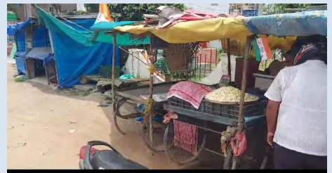
సర్కిల్ పరిధిలోని మౌలాబీ ఎస్సీనగర్ నుంచి ఇసీబిఎల్ వరకు, ఇసీబిఎల్ చౌరస్తా నుంచి చక్రిపురం, సైనిక్ పురి నుంచి ఇసీబిఎల్ వరకు , చక్రిపురం నుంచి చర్లపల్లి వైపు వెళ్లే రహదారులన్ని అస్తవ్యస్తంగా మారుతున్నారు. రహదారులకు ఇరువైపుల ఉన్న ఫుట్ పాత్ లను ఆక్రమణలకు గురికావడంతో పరిస్థితి మరింత జరిలంగా మారతోంది. నిత్యం వేలాది వాహనాలతో ఇక్కడి రహదారులన్నీ గజిబిజిగా ఉంటాయి. ఇక ఉదయం, సాయంత్రం వేళల్లో ట్రాఫిక్ సమస్యతో వాహనదారులు