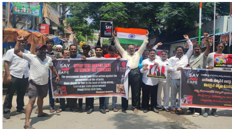
నగర్ డివిజన్ పరిధిలోని గౌతమ్ నగర్ చౌరస్తా నుండి మల్కాజిగిరి చౌరస్తా వరకు షకార్త్ తో నిరసన తెలుపుతూ

తెలంగాణ వీణ/మల్కాజిగిరి: ఇటీవల కోల్ కతా లో మహిళ డాక్టర్ పై జరిగిన అత్యాచారం, హత్యను ఖండిస్తూ ఆదివారం ఎస్ హెచ్ యూత్ ఫ్రెండ్స్ ఆధ్వర్యంలో నిరసన కార్యక్రమాన్ని చేపట్టారు. వైద్యురాలిపై అగత్యానికి తెగబడిన మానవ మృగాలను కేంద్ర రాష్ట్ర ప్రభుత్వాలు కఠినంగా శిక్షించాలని, జస్టిస్ ఫర్ డాక్టర్ అంటూ నినాదాలు చేస్తూ మల్కాజిగిరి నియోజకవర్గం గౌతమ్