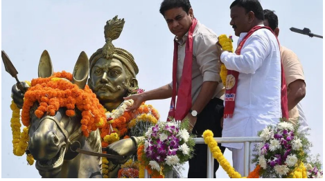
నామకరణం చేయాలని రాష్ట్ర ప్రభుత్వానికి విజ్ఞప్తి చేస్తున్నామన్నారు. అనంతరం సిరిసిల్ల పట్టణంలో జరుగుతున్న మార్గం దేయ ఆలయ నిర్మాణంలో భాగంగా మహా చండీయోగంలో కేటీఆర్ పాల్గొన్నారు. మహా చండీయోగంలో కేటీఆర్ పాల్గొని ప్రత్యేక పూజలు చేశారు. అనంతరం ఆలయ కమిటీ సభ్యులు, అర్చకులు కేటీఆర్ ను ఘనంగా సత్కరించారు.

- కాంగ్రెస్ ప్రభుత్వాన్ని డిమాండ్ చేసిన కేటీఆర్ తెలంగాణ వీణ/హైదరాబాద్,ఆగస్టు 18 : ట్యాంక్ బండ్ పై సర్కార్ సర్కారు పాపన్న గౌడ్ విగ్రహాన్ని ఏర్పాటు చేయాలని, రాష్ట్రంలోని ఏదో ఒక జిల్లాకు ఆయన పేరును పెట్టాలని కాంగ్రెస్ ప్రభుత్వాన్ని టీఆర్ఎస్ వర్కింగ్ ప్రెసిడెంట్ కల్వకుంట్ల తారకరామారావు డిమాండ్ చేశారు. సిరిసిల్ల పట్టణంలోని మొదటి బైపాస్ రోడ్డులోని సర్కార్ సర్కారు పాపన్న విగ్రహానికి పూలమాలలు వేసి నివాళు లర్పించారు. అనంతరం ఆయన మీడియాతో మాట్లాడారు. బహుజన రాజ్యాంగం కోసం, తెలంగాణ ప్రాంతంలో నిరంకుశత్వానికి వ్యతిరేకంగా పోరాడిన యోధుడు సర్కారు పాపన్న అని తెలిపారు. ఆయన ఆశయాలను సాధించే దిశగా గత కేటీఆర్ ప్రభుత్వం గ్రామీణ ప్రాంతాల్లో ఉన్న గొడవలకు చెట్ల పన్నులను, అప్పటిదాకా ఉన్న బకాయిలను పూర్తిస్థాయిలో మాఫీ చేసినందుకు గుర్తు చేశారు. ట్యాంక్ బండ్ పై సర్కారు పాపన్న గౌడ్ విగ్రహాన్ని ఏర్పాటు చేయడంతో పాటు ఏదో ఒక జిల్లాకు