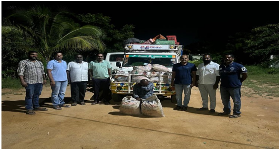
75 బ్యాగుల బెల్లం, ఒక బ్యాగులో 30 కేజీలు మొత్తం 2250 కేజీల బెల్లాన్ని, 5 లీటర్ల నాటుసారాను పట్టుకున్నారు. ఈ బెల్లాన్ని సరఫరా చేస్తున్న దేవుల తిరుమలాపూర్ గ్రామం పెద్దకోత్తపల్లి

తెలంగాణ వీణ/కర్నూల్,ఆగస్టు 18 : నాటుసారా తయారీకి వినియోగించే నల్లబెల్లం సరఫరా చేసే ఇద్దరు వ్యక్తులపై నాగర్ కర్నూల్ ఎక్సైజ్ అండ్ ఎన్ఫోర్స్ మెంట్ పోలీసులు కేసు నమోదు చేశారు. ఈ సందర్భంగా నిందితుల నుంచి 2,250 కిలోల నల్లబెల్లం స్వాధీనం చేసుకున్నారు. ఆంధ్రప్రదేశ్ రాష్ట్రంలోని కర్నూల్ నుంచి చాలా కాలంగా నాగర్ కర్నూల్ జిల్లాలోని తెలకపల్లి, కొల్లాపూర్ ప్రాంతాలకు నాటుసారాకు వినియోగించే బెల్లం, పటికను పోలీసులకు దొరకకుండా సరఫరా చేస్తూ ఉన్న ఒక వ్యక్తిని అరెస్ట్ చేశారు. మరో వ్యక్తి పరారీలో ఉన్నారు. మహబూబ్ నగర్ ఎక్సైజ్ ఎన్ఫోర్స్ మెంట్ పోలీసులు సక్కా అందుకున్న సమాచారం మేరకు ఆదివారం తెల్లవారుఝామన బిజినేస్ లి బస్టాండ్ దగ్గర లోడ్లు వద్ద వాహనాలు తనిఖీలు చేపట్టారు. కర్నూల్ నుంచి వచ్చిన టోటో పిక్ అప్ వాహనాన్ని నిలిపి తనిఖీలు నిర్వహించగా అందులో ఉన్న