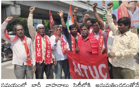
సమయంలో భారీ వాహనాలు సిటీలోకి అనుమతించడంతోనే