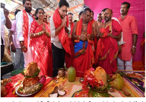
ఆలయ నిర్మాణానికి స్థానిక శాసనసభ్యుడిగా తన వంతు సహాయ సహకారాలు అందిస్తానని హామీ ఇచ్చారు. ప్రస్తుతం సిరిసిల్లలో నెలకొన్న నేతన్నల వస్త్ర పరిశ్రమ సంక్షోభం అమ్మవారి ఆశీస్సులతో తీరాలని కోరుకున్నట్లు తెలిపారు.