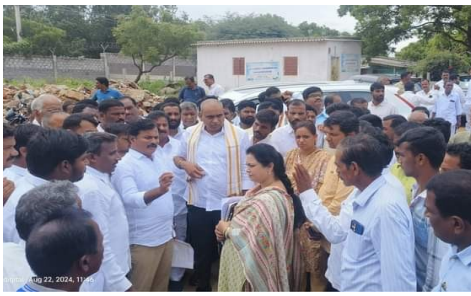
చాలా ఇబ్బందులు ఎదుర్కొంటున్నారని తెలిపాను. గతంలో ఈ పరిశ్రమలను పరిశీలించడానికి వచ్చినప్పుడు కాలుష్య కారక

తెలంగాణ వీణ/యాదాద్రి భువనగిరి/పోచంపల్లి, ఆగస్టు 22: ఈ ప్రాంత ప్రజలు, రైతులు కాలుష్యం వెదజల్లే పరిశ్రమలపై చర్యలు తీసుకోవాలని కోరడం జరిగింది. ప్రజలు పడుతున్న ఇబ్బందులను తెలుసుకొని, కాలుష్యం వెదజల్లే పరిశ్రమలను గతంలోనే పరిశీలించాం. పార్లమెంటులో కేంద్ర ప్రభుత్వంపై శాఖ మంత్రిని కూడా కోరడం జరిగింది. ఈ ప్రాంత ప్రజలు ఈ పరిశ్రమల వల్ల