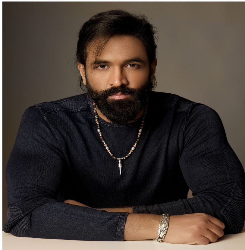
- చర్యలు తీసుకోవాలంటూ మంచు విష్ణు లేఖ

కల్పి 2898 ఏడీ: సినిమాలో ప్రభాస్ పాత్ర గురించి తక్కువ చేస్తూ బాలీవుడ్ నటుడు అర్జున్ వార్మీ మాట్లాడిన తీరుపై ఇప్పటికే వలువురు సినీ ప్రముఖులు స్పందించి ఖండించారు. తాజాగా మూవీ ఆర్టిస్ట్ అసోసియేషన్ మా అధ్యక్షుడు మంచు విష్ణు ఈ విషయంలో మూవీ అండ్ టీవీ ఆర్టిస్ట్ అసోసియేషన్ కు లేఖ రాశారు. 'కల్పి 2898 పై తన అభిప్రాయాన్ని ఇటీవల ఓ ఓంటర్వ్యూలో అర్జున్ వార్మీ పంచుకున్నారు. అయితే ఈ క్రమంలో ఆయన ప్రభాస్ పాత్ర గురించి చేసిన వ్యాఖ్యలు సోషల్ మీడియాలో వైరల్ అయ్యాయి. అవి టాలీవుడ్ నటుడు, అభిమానుల మనోభావాల్ని దెబ్బతీసేలా ఉన్నాయని అధ్యక్షురాలు పూనమ్ థిల్లాన్ కు రాసిన లేఖలో మంచు విష్ణు పేర్కొన్నారు. ప్రతి వ్యక్తికి వారి అభిప్రాయాన్ని వ్యక్తపరిచే హక్కు ఉంది. దాన్ని మేమూ గౌరవిస్తున్నాం. కానీ, అర్జున్ వ్యాఖ్యలు ప్రభాస్ ను తక్కువ చేసేలా ఉన్నందుకు బాధపడుతున్నాం. సోషల్ మీడియా ఇలాంటి విషయాలు త్వరగా వైరల్ అవుతాయి. ఆ విషయాన్ని అందరూ గమనించాలి. మాటకు చాలా శక్తి ఉంటుంది. అది ఇద్దరి మధ్య బంధాలను బలపరచగలదు, గొడవలూ సృష్టించగలదు. అర్జున్ కామెంట్స్ నెగటివ్ తీసుకొచ్చేలా ఉన్నాయి. నటీనటుల మధ్య ఐక్యత, గౌరవం కోసం ఎప్పుడూ ముందుండే లసోనియేషన్ అర్జున్ వ్యాఖ్యలపై స్పందిస్తుందని నమ్ముతున్నాం. మీ మద్దతు కోసం ఎదురుచూస్తున్నాం. భవిష్యత్తులో ఇలాంటి కామెంట్స్ చేయకుండా ఆయనకు సూచనలు చేస్తారని ఆశిస్తున్నాం. ప్రాంతాలతో, భాషతో సంబంధం లేకుండా నటీనటులంతా గౌరవంగా ఉండాలని కోరుతున్నాం. మనమంతా ఒకే కుటుంబంలో భాగమని అందరూ గుర్తుంచుకోవాలి. ఈ ఐక్యతను కాపాడుకుందాం అని తన లేఖలో మంచు విష్ణు అన్నారు.