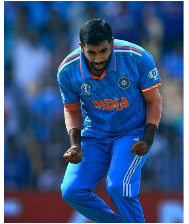
న్యూజిలాండ్ తో జరిగిన సిరీస్ తో బువ్రా మళ్లీ రీఎంట్రి ఇచ్చే ఛాన్స్ ఉంది.