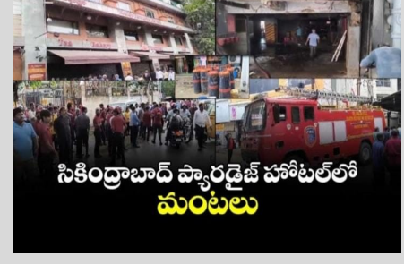
సికింద్రాబాద్ ప్యారడైజ్ హోటల్లో మంటలు

తెలంగాణ వీణ/హైదరాబాద్: నిత్యం కష్టమర్థతో రద్దీగా ఉండే సికింద్రాబాద్ ప్యారడైజ్ హెటాటల్లో ఒక్కసారిగా మంటలు చెలరేగడంతో హెటాటల్ సిబ్బందితో పాటు కష్టమర్థు తీవ్ర భయందోళనకు గురై తినే పేట్లను వదిలి బయటకు పరుగులు తీశారు. వెంటనే అప్రమత్తమైన హెటాటల్ స్టాఫ్ అగ్రమాపక సిబ్బందికి సమాచారం అందించారు. హుటాహుటిన ఘటన స్థలానికి చేరుకున్న ఫైర్ సిబ్బంది మంటలను పూర్తిగా ఆదుపులోకి తీసుకొచ్చారు. ఈ ప్రమాదంలో ఎవరికీ ఎలాంటి ప్రాణ హాని జరగలేదు. ఎవరూ గాయపడలేదు. కిచెన్ నుంచి భారీ ఎత్తున మంటలు రావటం చూసిన పని వారు కష్టమర్థు వెంటనే అప్రమత్తం అయ్యి బయటకు పరుగులు తీశారు. సిబ్బంది సైతం సకాలంలో స్పందించి మంటలను అదుపు చేయటంతో పెను ప్రమాదం తప్పింది. హెటాటల్ కిచెన్లో ఫైర్ సర్కూల్ కారణంగా ఈ ప్రమాదం జరిగినట్లు తెలుస్తోంది. కష్టమర్థకు ఎలాంటి ప్రమాదం జరగకపోవడంతో హెటాటల్ సిబ్బందితో పాటు అధికారులు ఊపిరి పీల్చుకున్నారు. ఈ ఘటనకు సంబంధించిన పూర్తి వివరాలు తెలియాల్సి ఉంది.