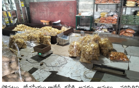
విలాంటి శుభ్రత పాటించుకుందానే తయారు చేస్తోన్న రింగులు