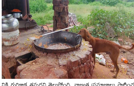
విలాంటి శుభ్రత పాటించుకుందానే తయారు చేస్తోన్న రింగులు

తెలంగాణవీణ/హైదరాబాద్: మార్కెట్లో లభించే తిను బండారాలపై అధికారుల పర్యవేక్షణ కొరవడటంతో అపరిశుభ్ర వాతావరణంలోనే మిక్చర్, చేగోడీలు, ఆలు చిప్స్, చక్కెల తయారీలు జోరుగా సాగుతోంది. కనిపించే తిను బండారాలన్ని లోట్లలోనుకూని తింటున్నారా? అయితే ఆసుపత్రి పాలు కాపటం ఖాయం. ఎందుకంటారా ఇవి తయారు చేసే ప్రాంతాలను చూస్తే అంతే... మురుగునీటి ప్రవాహం సమీపంలోనే విచ్చల విడిగా మిక్చర్, చేగోడీలు, చిరుతిండ్ల తయారీ జోరుగా సాగుతోంది. దుర్వాసన వ్యాపించే చోట, అపరిశుభ్రతకు నిలయంగా మారిన ముసీ మురుగునీటి సమీపంలోనే ఇష్టానుసారంగా మిక్చర్, చేగోడీలు, మిఠాయిల తయారీ కొనసాగుతోంది. అడ్డగోలుగా ఆహార పదార్థాల తయారీ జోరుగా సాగుస్తూ ప్రజల ఆరోగ్యంతో చలగాట మారుతున్నా... అధికారులు మాత్రం ఇటువైపు కన్నెత్తి చూడక