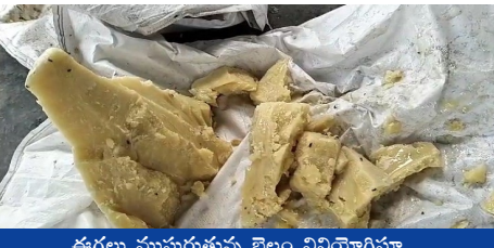
ఈగలు ముసురుతున్న బెల్లం వినియోగిస్తూ...