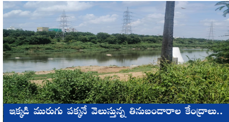
ఇక్కడి మురుగు పక్కనే వెలుస్తున్న తినుబండారాల కేంద్రాలు..