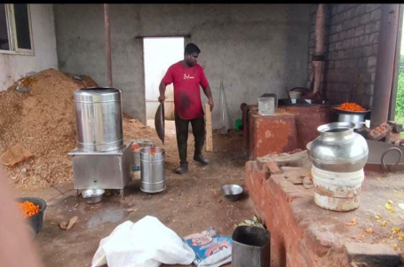
విలాంటి శుభ్రత పాటించుకుందానే తయారు చేస్తోన్న రింగులు