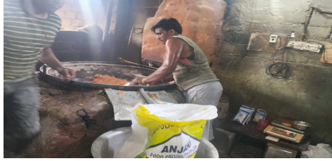
విలాంటి శుభ్రత పాటించుకుందానే తయారు చేస్తోన్న రింగులు