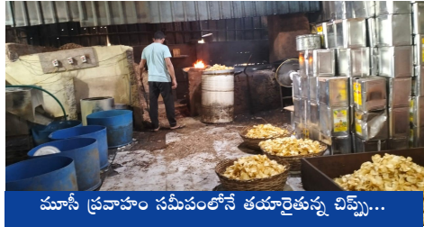
ముసీ ప్రవాహం సమీపంలోనే తయారైతున్న చిప్స్...