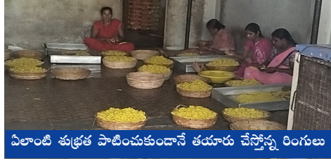
విలాంటి శుభ్రత పాటించుకుందానే తయారు చేస్తోన్న రింగులు