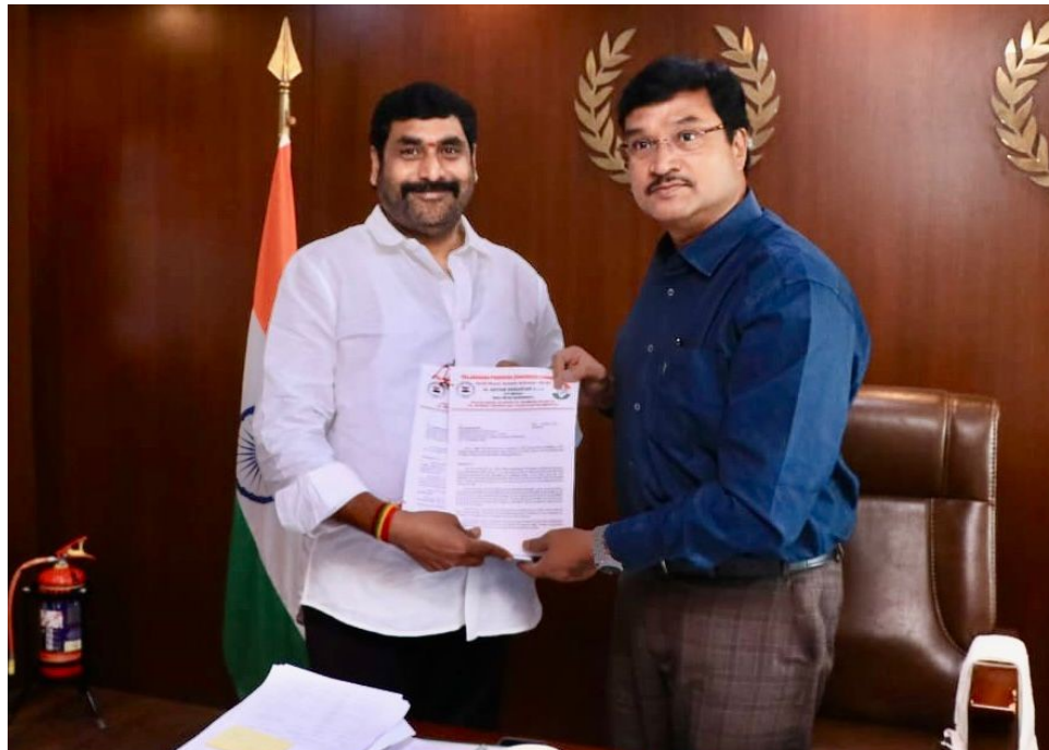
అక్రమణల మీద నోటీసులు ఇచ్చి కూల్చివేయాలన్నారు. విచారణ జరిపి వారిపై తక్షణమే చర్య తీసుకోవాలన్నారు. అక్రమణలకు ఆ కాలంలో అనుమతులు ఇచ్చిన అధికారుల్ని

- డిప్యూటీ అధికార ప్రతినిధి డా. సత్యం శ్రీరంగం తెలంగాణవీణ/కూకట్ పల్లి : కూకట్ పల్లి నియోజకవర్గంలో చెరువులు, కుంటలు అక్రమించి చేపట్టిన నిర్మాణాలను తక్షణమే తొలగించి అనుమతులు ఇచ్చిన అధికారులపై విచారణ జరిపి చర్యలు తీసుకోవాలని డిప్యూటీ అధికార ప్రతినిధి డా. సత్యం శ్రీరంగం అన్నారు. కూకట్ పల్లి నియోజకవర్గం పరిధిలో కనుమ రుగు అవుతున్న చెరువులు నాశనం పరిరక్షించేందుకు హైద్రా కమీషనర్ రంగనాథ్ ని గురువారం ఆయన కలిసి కూకట్ పల్లి నియోజకవర్గంలో ఉన్న చెరువులు, నాశనం పూర్తి వివరాలను అందించి వాటి యొక్క కట్టాల వివరాలను వివరించారు. ఈ సందర్భంగా సత్యం శ్రీరంగం మాట్లాడుతూ గతంలో బిఆర్ఎస్ అధికారంలో ఉన్నప్పుడు స్థానిక ప్రజా ప్రతినిధి ప్రోద్బలంతో కూకట్ పల్లి నియోజకవర్గంలో అక్రమ కట్టడాలకు హద్దు అదుపు లేకుండా పోయిందన్నారు. ఆ అక్రమణల్లో భీముని కుంట, కాముని చెరువు, రంగధాముని కుంట, సున్నం చెరువు, పరికి చెరువు, నల్ల చెరువు, మైసమ్మ చెరువు, ముండ్ల కత్త అనే చెరువులు కూడా ఉన్నాయని, కైతలాపూర్ కుంట, ఖాజా కుంట , కూకట్పల్లిలో నాశనం సంఖ్య , బాలానగర్ లో 150 ఫీట్లు ఉన్న నాశాని పూడ్చి 40 ఫీట్లు చేసారన్నారు. టోయిన్ పల్లి వద్ద టోయిన్ చెరువులు , నాలాలన్నీ అక్రమ అక్రమణలకు గురయ్యాయని, మైసమ్మ చెరువు , రంగనాయకి చెరువు సుందరీకరణ పేరుతో దాన్ని కట్టా చేసారన్నారు. దీని ఫలితంగా సహజ పర్యావరణ వ్యవస్థ , నీటి వనరులకు ముప్పు ఏర్పడుతుందన్నారు. అక్రమ అక్రమణల యొక్క నిజానిజాలను తెలుసుకోవడానికి ప్రభుత్వ భూములు కాపాడడానికి వెంటనే కూకట్ పల్లి వచ్చి