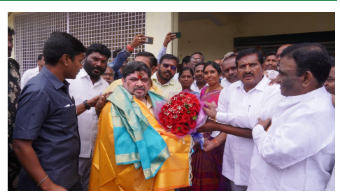
తయారు చేయాలని అధికారులను కోరినట్లు తెలిపారు. షెడ్ల ఎదగడానికి ప్రతిపాదనలు తయారు చేయాలని సూచించారు.