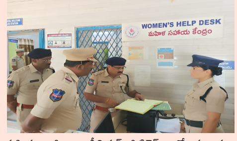
మహిళలు, పిల్లలు, సీనియర్ సిటిజెన్ లతో మర్యాదగా

తెలంగాణవీణ/మంచిర్యాల: జోన్ పరిధి మంచిర్యాల పోలీస్ స్టేషన్ ను (జీ ఎగ్గడి భాస్కర్ ఐ. పి.యస్., డి.సి.పి. మంచిర్యాల. సాధారణ తనిఖీలలో భాగంగా తనిఖీ చేసి పోలీస్ స్టేషన్ సిసిసి పిటిషన్ ల వాటి రికార్డ్ లను తనిఖీ చేశారు. సిబ్బంది పనితీరు, నమోదు చేయబడిన కేసులలో ప్లాన్ ఆఫ్ యాక్షన్, ప్రజలతో, ఫిర్యాదుదారులతో ఎలా (పవర్తిస్తున్నారు. పోలీస్ స్టేషన్ కు వచ్చే బాధితుల పిర్యాదుల విషయం లో వెంటనే స్పందించి విచారణ చేపట్టి బాధితులకు న్యాయం జరిగే విధంగా చూడాలి.