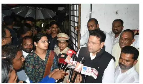
కారణంగా ఆస్తి, ప్రాణ నష్టం జరగకుండా అధికారులు చర్యలు చేపట్టాలన్నారు శిథిలా వస్థలో ఉన్న ఇండ్లలో నివసిస్తున్న వారిని సురక్షిత మ్రాంతాలకు తరలించాలన్నారు. జిల్లాలోని ఖానాపూర్, దస్తురాబాద్, పెంబి మండలాలలో అధిక వర్వపాతం నమోదు

తెలంగాణవీణ/నిర్మల్,సెప్టెంబర్ 2 : జిల్లాలో కురుస్తున్న భారీ వర్నాల కారణంగా ఎలాంటి ప్రాణ, ఆస్త్రి నష్టం జరగకుండా అధికా రులు అవసరమైన సహాయక చర్యలు చేపట్టాలని రాష్ట్ర ఐటీ, పర్మిశమల శాఖ మంత్రి జ్రీధర్ బాబు అధికారులను ఆదేశించారు. సోమవారం రాత్రి జిల్లా కలెక్టర్ అభిలాష అభినవ్, ఎస్స్టీ జానకి షర్మిల, ఖానాపూర్ శాసనసభ్యులు వెద్మ బొజ్జు పటేల్ లతో కలిసి కడెం ప్రాజెక్టును పరిశీలించారు. ప్రాజెక్టు లోని వరద నీరు ఇన్ ఫ్లో, అవుట్ ఫ్లో వివరాలను ఇంజనీరింగ్ అధికారులను అడిగి తెలుసుకున్నారు. ఈ సందర్భంగా మంత్రి మాట్లాడారు. వర్నాల