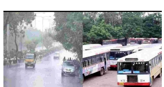
ఎడతెరిపి లేకుండా వర్నాలు కురుస్తున్నాయి. మహారాష్ట్రలోని విదర్భలో భారీ నుంచి అతి భారీ వర్సాలు కురుస్తాయని ఐఎండీ హెచ్చరించింది. ఈ క్రమంలోనే విదర్భకు ఐఎండీ రెడ్ అలర్ట్ జారీ చేసింది. వెస్ట్ మధ్యప్రదేశ్, మరాఠవాడ,తెలంగాణ, గుజరాత్

తెలంగాణవీణ/హైదరాబాద్,సెప్టెంబర్ 2 :తెలుగు రాడ్ట్రాల్లో వానలు దంచికొ డుతున్నాయి. ఈ క్రమంలో ఆర్టీసీ బస్సులను రద్దు చేయాలని అధికారులు నిర్ణయించారు.నిన్న రాత్రి వరకు 877 బస్సులను తెలంగాణ ఆర్టీసీ రద్దు చేసింది. ఈరోజు సోమవారం ఉదయం నుంచి 570 బస్సులను రద్దు చేశారు. ముఖ్యంగా ఖమ్మం, విజయవాడ , మహబూబ్బాద్ వైపుగా వెళ్ళే రోడ్లన్నీ జలమయం అవ్వడంతో బస్సు రూట్లన్ను పూర్తిగా బంద్ చేశారు.వరద ఉధృతి తగ్గిన తర్వాత మళ్ళీ బస్సులను నడుపుతామని ఆర్టీసీ అధికారులు అంటున్నారు. హైదరాబాద్ నుంచి విజయవాడకు వెళ్లే బస్సులను గుంటూరు మీదుగా దారిమల్లించారు.ఖమ్మం జిల్లాకు యధావిధిగా బస్సులను ఆర్టీసీ నడుపుతోంది.నేడు కూడా అతిభారీ వర్నాలు. భారీ నుంచి అతి భారీ వర్నాలు కురిసే అవకాశముందని ఐఎండీ ప్రకటించింది. బంగాశాఖాతంలో అల్పపీడనంతో దేశ వ్యాప్తంగా పలు రాష్ట్రాల్లో