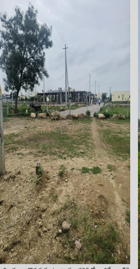
అధికారులు గొదుమకుంట గ్రామ పరిధిలో జరిగే వాటిపై మాత్రం (పేక్షక పాత్ర వహించడంలోని అంతర్యమేమిటోనని స్పందించి అక్రమ లేవుట్లు, లేవుట్లలో వెలుస్తున్న నిర్మాణాలపై స్థానికులు ప్రశ్నీస్తున్నారు. ఇప్పటికైనా జిల్లా ఉన్నతాధికారులు సమగ్ర విచారణ చేపట్టలని స్థానికులు కోరుతున్నారు.