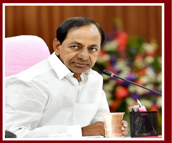
అతికించారనే విషయం తెలియరాలేదు. కానీ కేసీఆర్ వైఖరి చర్చనీయాంశమైంది