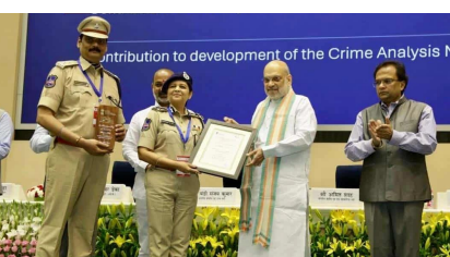
తెలంగాణవీణ/హైదరాబాద్, సెప్టెంబర్ 10 : సమన్వయ ప్లాట్ ఫాంలో నేర విశ్లేషణ మాడ్యూల్ అభివృద్ధిలో తెలంగాణ ముంద్ర పోలీసు శాఖ చూపిన ప్రతిభకుగానూ కేంద్ర హోం