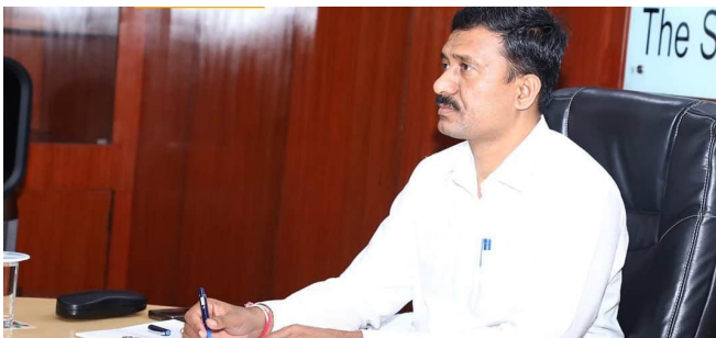
అంకితభావంతో పనిచేసి రక్షణతో ఉత్పత్తులు సాధించాలని పిలుపునిచ్చారు. గత మూడు నెలల్లో వర్షాల కారణంగా సప్లైలో అంతేమంది ఉత్పత్తి నష్టాన్ని భరించేసేందుకు కృషి

తెలంగాణవీణ/హైదరాబాద్: రాష్ట్రంలోని ధర్మల్ పవర్ స్టేషన్లకు బొగ్గు కొరత లేకుండా బొగ్గును సరఫరా చేయాలని, ఇందుకోసం రోజుకు కనీసం రెండు లక్షల టన్నుల బొగ్గును ఉత్పత్తి చేసి అంతే మొత్తంలో రవాణా చేయాలని సింగరేణి చైర్మన్, ఎం.డి ఎన్.బలరాం అన్ని ఏరియాల జనరల్ మేనేజర్లను ఆదేశించారు. ఈరోజు (శనివారం) ఆయన అన్ని ఏరియాల జీఎంలతో వీడియో సమావేశం నిర్వహించారు. ఈ సందర్భంగా ప్రతి ఏరియా ఉత్పత్తిని ఆయన సమీక్షించారు. భారీ వర్షాల కారణంగా ఓపెన్ కాస్ట్ గనుల్లో నిలిచిన నీటిని తక్షణమే తొలగించాలని, అవసరమైతే అదనపు పంపులను వినియోగించి బొగ్గు ఉత్పత్తిని పెంచాలని సూచించారు. రోజుకు కనీసం 14 లక్షల క్యూబిక్ మీటర్ల ఓవర్ బయ్డ్ తొలగించాలని కోరారు. రాష్ట్ర విద్యుత్ అవసరాలకు సరిపడా బొగ్గును అందించాలని బాధ్యత సింగరేణి కంపెనీపై ఉందని, ఉద్యోగులు, అధికారులు దీనిని దృష్టిలో ఉంచుకుని