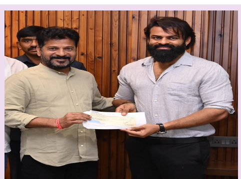
ముఖ్యమంత్రిని కలిసిన యువ నటుడు విశ్వక్ సేన్ గారు విరాళం చెక్కును అందజేశారు. సహాయ కార్భక్రమాల్లో ప్రభుత్వా నిధికి విరాశాలు అందించారు. జూబ్లీహిల్స్ నివాసంలో చారు. అలాగే, సీనియర్ నటుడు అలీ 3 లక్షల రూపాయల మంత్రి సీతక్క ఎంపీ కడియం కావ్య, ఇతర నేతలు ఉన్నారు.