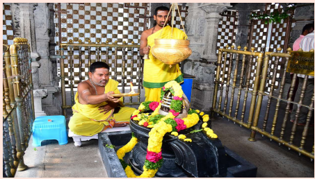
శ్రీ లక్ష్మీనరసింహస్వామి కొండపైన పర్వత రామలింగేశ్వర స్వామి సన్నిధిలో సోమవారం సందర్భంగా ప్రత్యేక పూజలు అభిషేకాలు జరిగాయి.