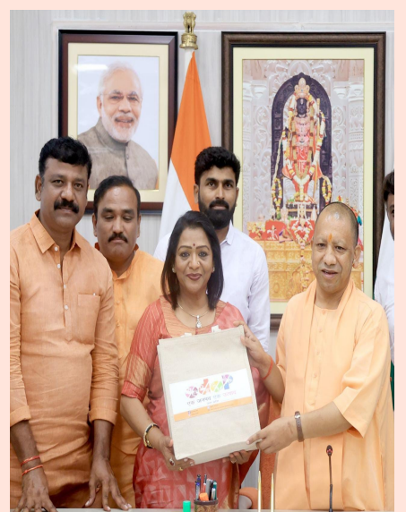
తెలంగాణ వీణ/మల్కాజ్ గిరి: ఉత్తరప్రదేశ్ ముఖ్యమంత్రి యోగిని జిహాచ్ ఎంసి బృందం కలిశారు. లక్నోలో జిహాచ్ ఎంసి బృందం అధ్యాయానికి వెళ్ళారు. ఈ సందర్భంగా యోగి వన్ నేషన్ ప్రోడక్ట్, గో మాతి రివర్ ప్రంట్ డెవలప్మెంట్ ఏ విధంగా చేశారు బృందానికి సీఎం తెలిపారు.