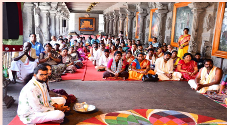
తెలంగాణ వీణ/యాదగిరిగుట్ట: యాదగిరిగుట్ట శ్రీలక్ష్మీ నరసింహస్వామి నిత్య కళ్యాణం వైభవంగా జరిగింది. వేదమంత్రాల తో అంగరంగ వైభవంగా తిలకించినవారికి కన్నుల పండుగ గా భక్త జనం ఆనంద పారవశ్యంలో మునిగి తేలుతున్న ఉన్న ఈ కార్యక్రమం జరిగింది