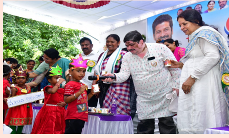
తీసుకోవాలి... ప్రతి ఒక్కరూ పౌష్టికాహారం తీసుకోవాలని మంత్రి పొన్నం ప్రభాకర్ అన్నారు. ముఖ్యంగా గర్భిణులు సరైన జాగ్రత్తలు తీసుకోవాలన్నారు. గర్భిణులు పౌష్టికాహారం తీసుకుంటే పుట్టిన బిడ్డ ఆరోగ్యంగా ఉంటారని చెప్పారు. ఈ కార్యక్రమానికి ప్రజలందరూ సహకరించాలని కోరారు. ఏజెన్సీలో రక్తహీనత సమస్య... పంచాతీయ రాజ్ శాఖ మంత్రి సీతక్క