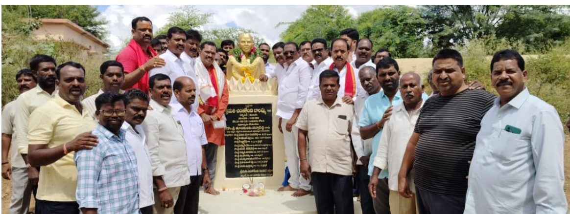
తెలంగాణ వీణ ములుగు