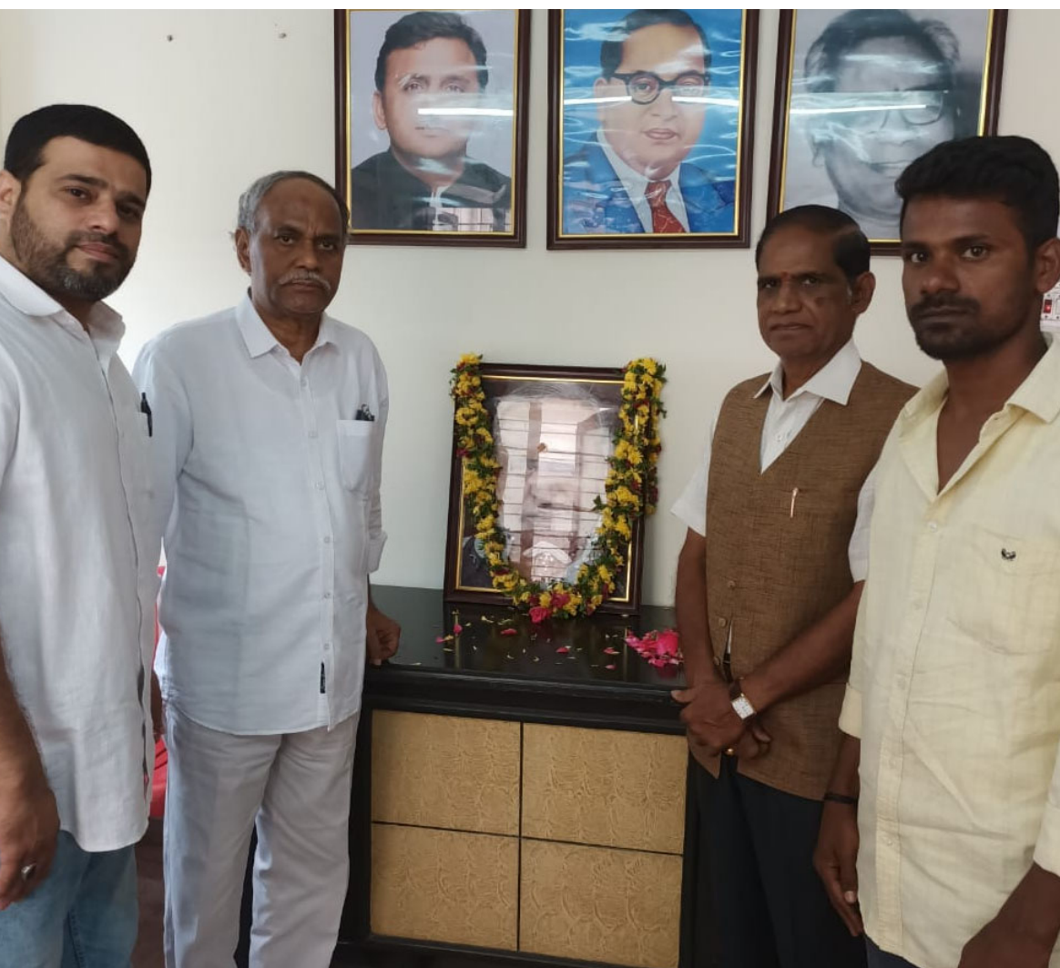
తెలంగాణ వీణ, హైదరాబాద్...