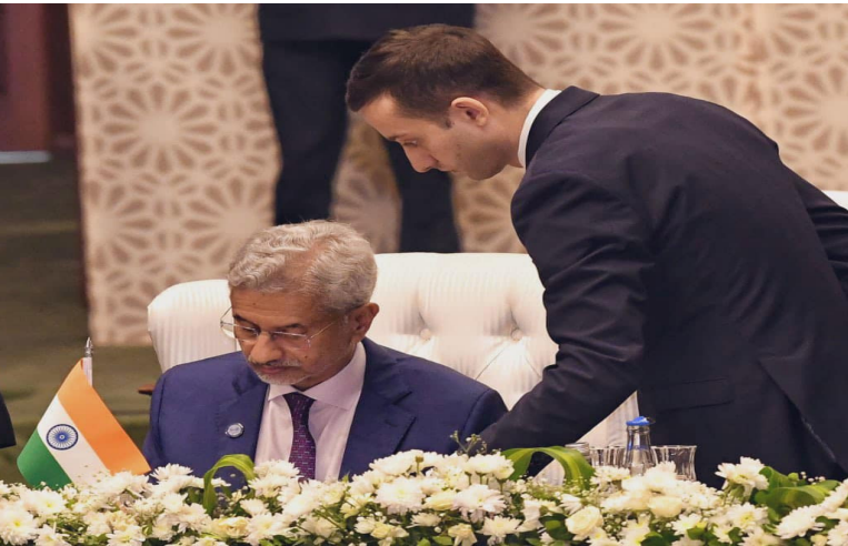
ఇస్లామాబాద్, అక్టోబర్ 16 (తెలంగాణ వీణ):

పాకిస్తాన్లో జరుగుతోన్న ఘోషై సహకార సంస్థ (ఎన్ఎస్ఐ) సదస్సులో మాట్లాడిన భారత విదేశాంగశాఖ మంత్రి ఎన్ జయశంకర్. షెహబాజ్ షరీఫ్ ప్రభుత్వానికి చురకలు వేశారు. సీమాంతర ఉగ్రవాదం గురించి ప్రస్తావించి విమర్శలు చేశారు. రెండు దేశాల మధ్య సంబంధాలు ఎందుకు దెబ్బతిన్నాయో ఆత్రుపరిశీలన చేసుకోవాలని సూచించారు. సమృద్ధి, సహకారం, స్నేహం లోపిస్తే పొరుగువారు దూరమవుతారని వ్యాఖ్యానించారు. సరిహద్దుల్లో తీవ్రవాదం, ఉగ్రవాదం, వేర్యాల వాద కార్యకలాపాలు ఉంటే... ఆ