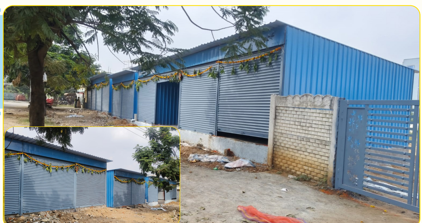
బండగూడలో అధికారులు కూల్చివేతలు చేపట్టినా... యధేచ్ఛగా వెలసిన షెట్లర్లు