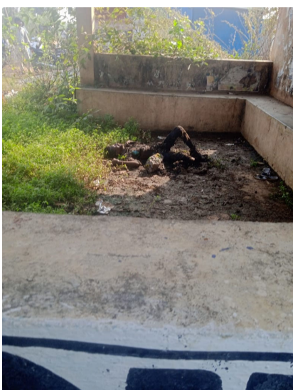
మాట్లాడుతూ గత పది రోజుల క్రితం జరిగిన హత్యకు సంబంధించిన వ్యక్తి కూడా ఎవరు అనేది తెలియలేదని సీసీ ఫుటేజీ ల ఆధారంగా ఆధారాలు