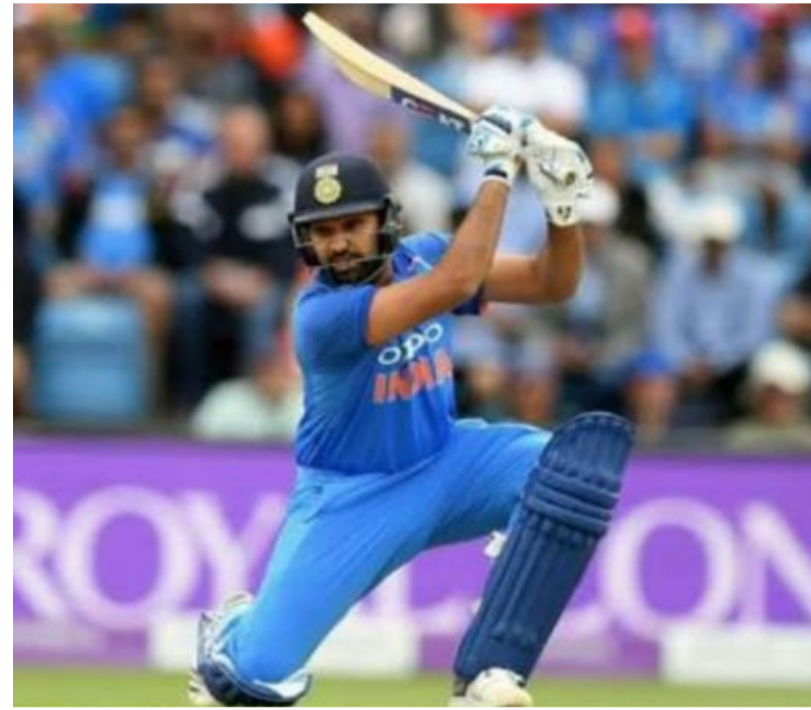
ఇప్పుడు అలా చేయడం లేదు. అప్పుడు అతడు తన టెక్నిక్ ను విశ్వసించేవాడని తెలిపాడు. ఇక స్టడీశంట్ జరిగిన గత రెండు టెస్టు సిరీస్ లో విరాట్ కోహ్లి, రోహిత్ శర్మ పేలవ ప్రదర్శనలపై మాజీ క్రికెటర్, వ్యాఖ్యాత ఆకాశ్ చోప్రా మండిపడ్డారు. వారి కేరెన్ ముగింపునకు ఇదే నాంది అని పేర్కొన్నారు.

సొంతగడ్డపై తొలిసారిగా టెస్టు సిరీస్ ను 0-3 తేడాతో అవమానకర రీతిలో ఓడటంతో టీమిండియాపై విమర్శలు వెల్లువెత్తుతున్నాయి. ముఖ్యంగా వేళ్లన్నీ సారథి రోహిత్ శర్మ వైపు చూచుతున్నాయి. ఈ సిరీస్ లో పేలవమైన ప్రదర్శనతో రోహిత్ తీవ్రంగా నిరాశపరిచాడు. గత కొంతకాలంగా టెస్టుల్లో ఫామ్ లేక ఇబ్బంది పడుతున్నాడు. ఈ నేపథ్యంలో రోహిత్ ఎక్కువ తప్పులు చేస్తున్నాడో అతడి సహచరుడు దినేష్ కార్తీక్ వివరిస్తూ, పలు సలహాలు ఇచ్చాడు. రోహిత్ టెస్టుల్లో గత 10 ఇన్నింగ్స్ లో చేసిన పరుగులు 133 మాత్రమే. దూకుడుగా ఆడేందుకు వెళ్లి వికెట్ సమర్పించుకుంటున్నాడు. న్యూజిలాండ్ జరిగిన అఖిర్ టెస్టు రెండో ఇన్నింగ్స్ లో పెద్ద షాట్ ఆడేందుకు ప్రయత్నించి పెవిలియన్ చేరాడు. దీనిపై దీక్ష స్పందిస్తూ.. ఇలాంటి అప్రోచ్ వైట్ బాల్ క్రికెట్ లో ఆరంభంలో అతడికి గొప్ప ఫలితాలిచ్చిందేమో కానీ.. టెస్టుల్లో తన వైఖరిని మార్చుకోవాల్సిన అవసరం ఉందని సూచించాడు. టెస్టుల్లో పెద్ద షాట్లు ఆడకుండా ఉండాలని కార్తీక్ పేర్కొన్నాడు. టెస్టుల్లో ఇబ్బందుల్లో ఉన్నప్పుడు దూకుడుగా ఆడాలని రోహిత్ భావిస్తున్నాడని నేను అనుకుంటున్నా. వైట్ బాల్ క్రికెట్ లో ఆడిన అప్రోచ్ టెస్టు క్రికెట్ కు పనిచేయదు. కొద్దిగా ఒత్తిడికి గురికాగానే ప్రమాదకరమైన అటాకింగ్ షాట్ లకు ప్రయత్నిస్తున్నాడని దినేష్ అన్నాడు. ఇక రోహిత్ తన టెక్నిక్ ను సమర్థుకోవాలని.. భారీ షాట్లకు వ్యతిరేకంగా మరింత బ్యాలెన్స్ డివైజ్ తో ఆడాలని సూచించాడు. రోహిత్ శర్మ ఓపెనర్ గా తన బాధ్యతలను స్వీకరించినప్పుడు గతంలో ఏం చేశాడో తెలియజేస్తూ సమస్యలన్న దినేష్