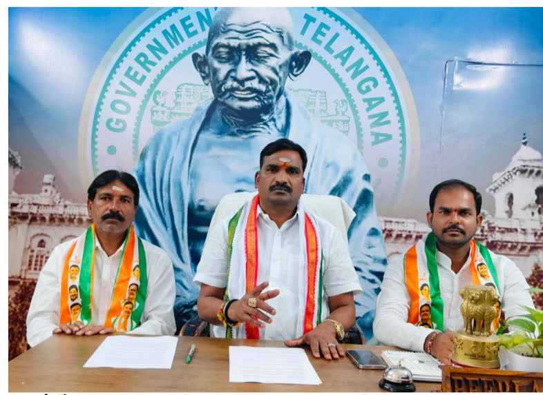
బీజేపీ పాలిత రాష్ట్రాల్లో మాత్రం సదులను ప్రక్షాళన చేయొచ్చు.. లక్షల మంది ని అక్కడి నుంచి ఖాళీ చేయించవచ్చు కానీ తెలంగాణలో మాత్రం మూసీ ప్రక్షాళన చేయొద్దా..? ఇదెక్కడి న్యాయమని ప్రశ్నించారు. కేవలం రాజకీయాల కోసమే బీజేపీ మూసీ పైన

లేకుండా ఆరు బయట బీజేపీ నాయకులు నిద్ర పోవాలని చాలెంజ్ విసిరారు. మీడియా కోసమే కిషన్ రెడ్డి, బీజేపీ నాయకులు పో చేస్తున్నారన్నారు. మూసీ బాధితులపై మిక్చు మాత్రం ప్రేమ ఉన్నా మూసీ పునరుజ్జీవ ప్రాజెక్టు కు సహకరించాలన్నారు. మూసీ పునరుజ్జీవం కావాలి కాని ఎవరిని అక్కడి నుంచి ఖాళీ చేయించవద్దని కిషన్ రెడ్డి అర్థం లేకుండా మాట్లాడుతున్నారని అన్నారు. సబర్బి, సమామీ గంగి కార్యక్రమాల కోసం అక్కడ ఎవరిని ఖాళీ చేయించలేదా..? అని ప్రశ్నించారు. గుజరాత్ లో 40 వేల కుటుంబాలను తరలించారని, మరందరికో పునరావాసం కల్పించకుండా మోసం చేసిన ఘనత మీది అన్నారు. కిషన్ రెడ్డి కి ఏ మాత్రం సికింద్రాబాద్, హైదరాబాద్ ప్రజల పైన ప్రేమ ఉన్నా మూసీ ప్రజలకు కు సహకరించాలన్నారు. కేంద్రంలో మాట్లాడి మంది కార్యక్రమానికి నిధులు తీసుకురావాలన్నారు.