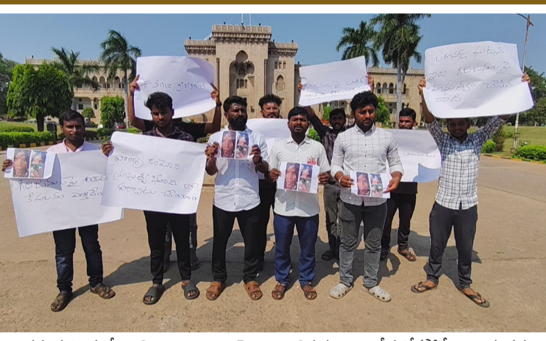
ఉపసంహరించుకోవాలని, లంబాదాపై పెట్టిన కేసులను వెనక్కి తీసుకోవాలని డిమాండ్ చేశారు. ఈ విషయంపై రాష్ట్ర ప్రభుత్వం వారం రోజుల్లో తగిన సానుకూల నిర్ణయం తీసుకోకపోతే యావత్తు పెట్టిన కేసులను వెనక్కి తీసుకోవాలని డిమాండ్ చేశారు. ఈ విషయంపై రాష్ట్ర ధీల్లీ కార్యక్రమానికి పిలుపునిస్తామని హెచ్చరించారు.