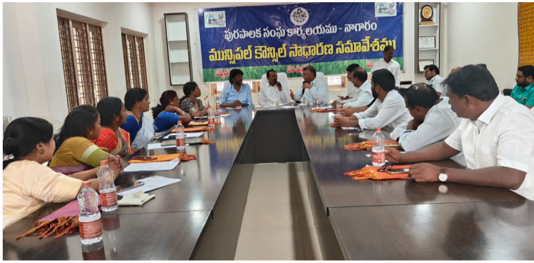
తెలంగాణవీణ, కీసర :

రూ. 7.8 కోట్ల నిధులకు కౌన్సిల్ తీర్మాణం..