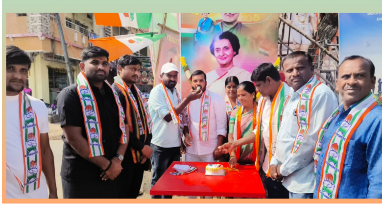
చేగుంట తెలంగాణ వీణ నవంబర్ 19

చేగుంట మండల కేంద్రంలోని గాంధీ చౌరస్తా వద్ద భారతదేశ తొలి మహిళ ప్రధానమంత్రి, భారతరత్న స్వర్ణీయ శ్రీమతి ఇందిరా గాంధీ 107వ జయంతి సందర్భంగా వారి చిత్ర పటానికి పూలమాలవేసి ఘనంగా నివాళులు సమర్పించిన చేగుంట మండల కాంగ్రెస్ పార్టీ నాయకులు. ఈ సందర్భంగా