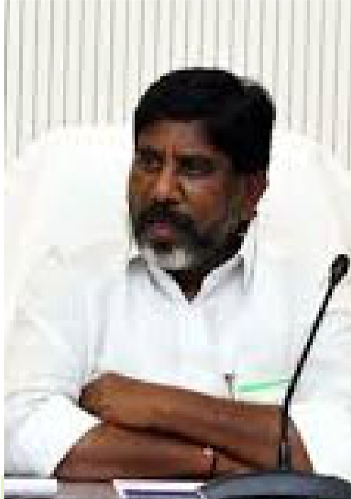
కోటి మంది మహిళలను కోటిశ్వరులను చేస్తాం