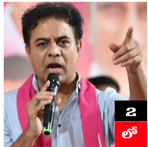
అగ్రరాజ్యం అమెరికానే మోసం చేయాలని చూసిన ఘనుడు

భారత ప్రభుత్వ అధికారులకు లంచం ఇవ్వజూపిన మోసగణాడు అదానీతో కార్గెస్, జిజీపీ అనుబంధం దేశానికే అవమానం