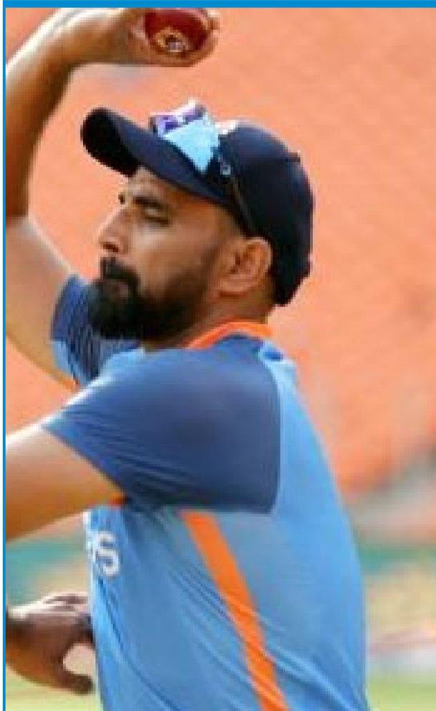
బాబాజీ కి జై హవా. మీ భవిష్యత్తు కోసం