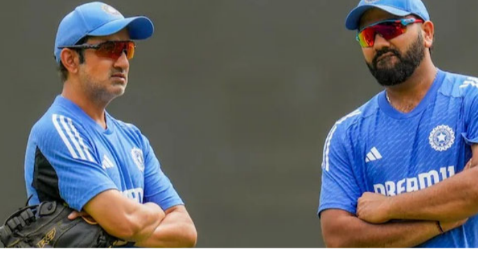
పాకీ కోట్ గా నియమితులైన నాటి నుంచి గౌతమ్ గంభీర మారిపోయాడు. జట్టు ఆటగాళ్లతో కలిసిపోవడం మొదలుపెట్టాడు. అయితే ఫలితాలు మిత్రమంగా వచ్చాయి. ఇప్పుడు త్వరలో జరగబోయే ఆస్ట్రేలియా సినీస్ పై ఉత్సాహం ఏర్పడింది. అటాకల్స్ మాత్రమే కాకుండా పాకీ కోట్ గౌతమ్ గంభీర భవిష్యత్తును కూడా నిర్ణయించనుంది. ఇదీవల న్యూజిలాండ్ జట్టుతో