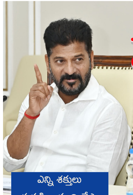
ఎన్ని శక్తులు అడ్డుపడినా పూర్తి చేస్తాం