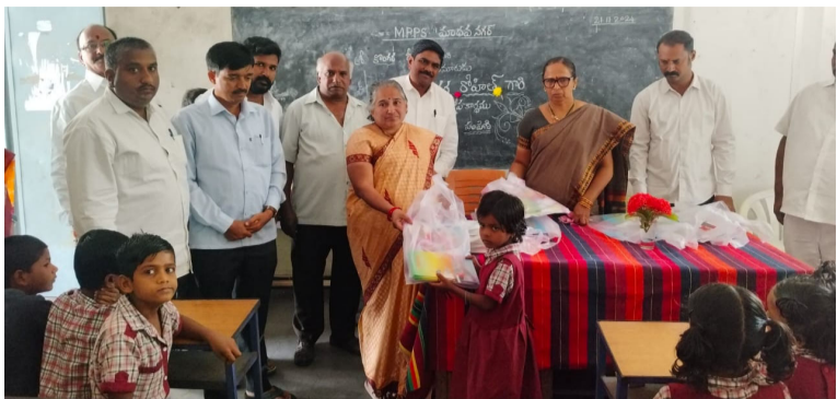
తెలంగాణ వీణ హైదరాబాద్.